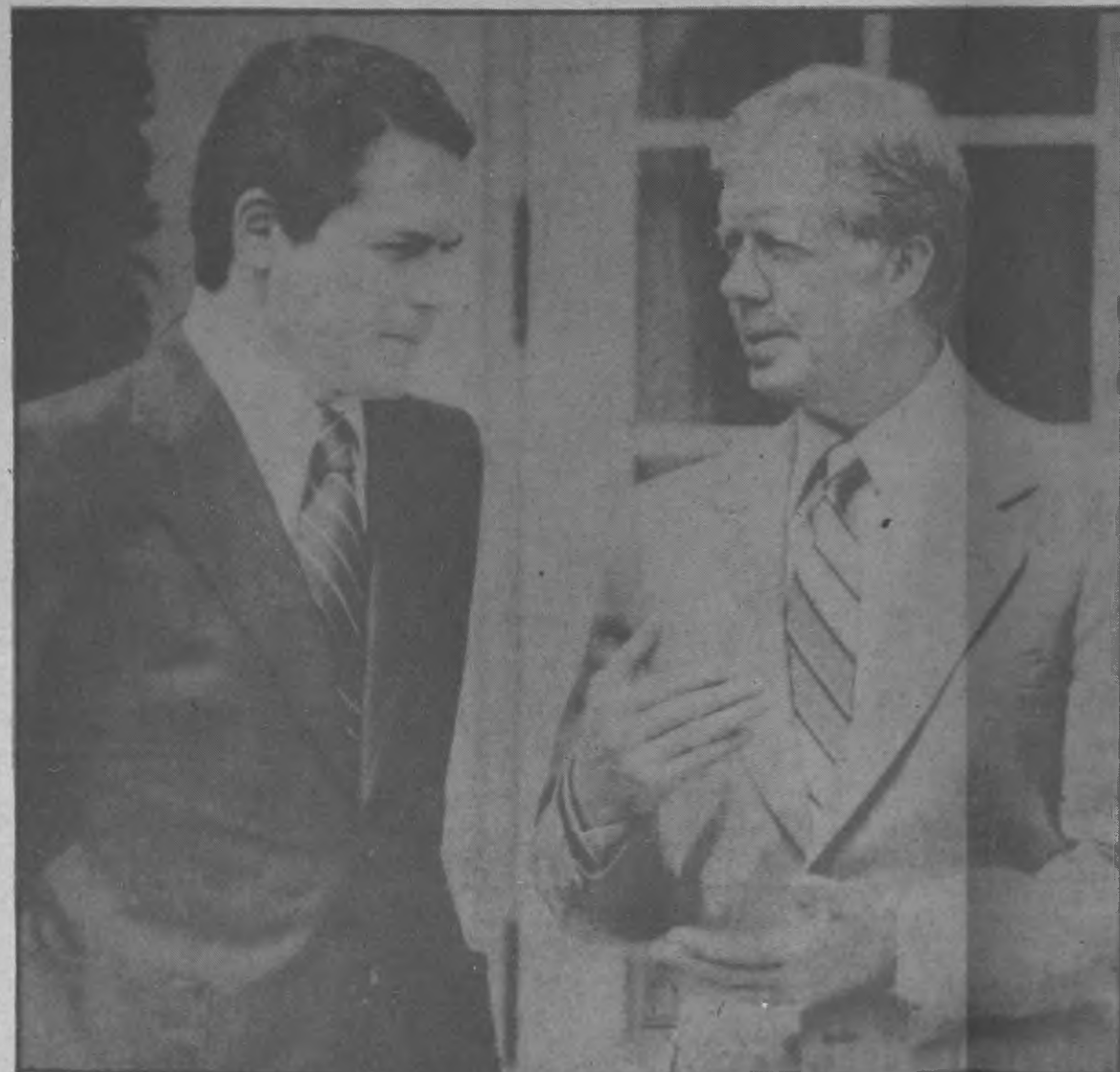
WASHINGTON — El Presidente Carter conversa con Aristides Royo, Presidente de Panamá, en las afueras de la oficial Oval de la Casa Blanca. Carter manifestó que él esperaba que la

legislación para la puesta en ejecución de los Tratados sobre el Canal reflejara "la letra y el espíritu" de lo pactado. (Radiofoto UPI).