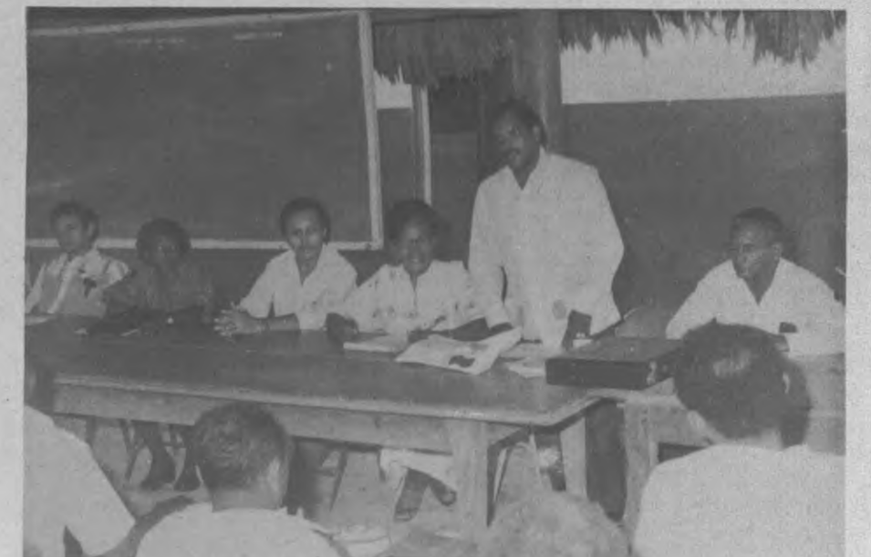
Blas Macre Viveros, Legislador por la Provincia, quien recientemente presentó al pleno de la Camara Legislativa un anteproyecto de ley, en donde la misma prohíbe la pesca de Camarón y pescado a menos de 3 milla entre las costas del Darién. Cuando el legislador Macre, presentó esta resolución lo hizo para preservar la vida marina y crearle funciones a la Cooperativa de Pescadores quienes en la actualidad cuentan con más de 20 embarcaciones especiales para la captura de este producto y que generaria fuentes de trabajo y daría alimentación permanente a cientos de familias darienitas.