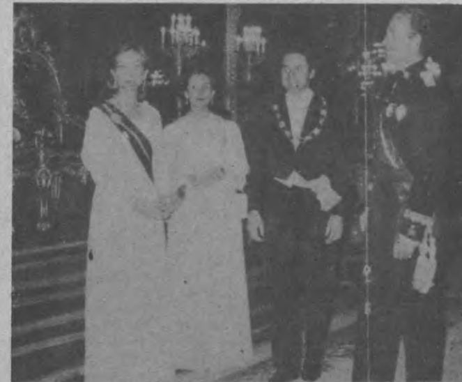
En la entrada del Palacio Real, los Reyes de España acompañados del Presidente y Sra. de Royo, se aprestan a recibir a los invitados a la cena de gala.

Cena de Gala en el Palacio Real en Honor del Presidente de Panamá y su esposa