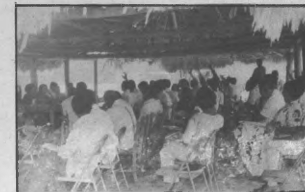
Esta escena nos presenta los momentos en que los honorables Representantes de Corregimientos procedían a votar a favor de la resolución en donde ellos solicitaban la entrega de la primera partida de los Doscientos Cincuenta Mil (250,000) para apoyar las gestiones de sus corregimientos, se aprecia en la gráfica cuando levantan la mano en señal de aprobación.

objetiva todas las demandas de los representantes y que una de las metas manifestaron los diferentes funcionarios era brindarles todo el apoyo al poder popular ya que esa era