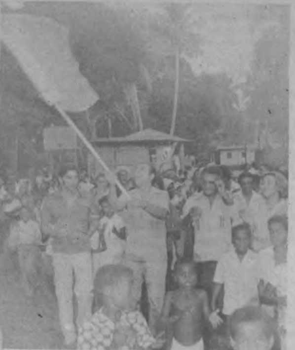
Otra gráfica en la que se observa al abanderado de la patronales de Boca de Cupe recorriendo unas de las calles de la Comunidad, al lado se aprecia al Embajador de Panamá en Honduras Licenciado Salvador de la Iglesia.