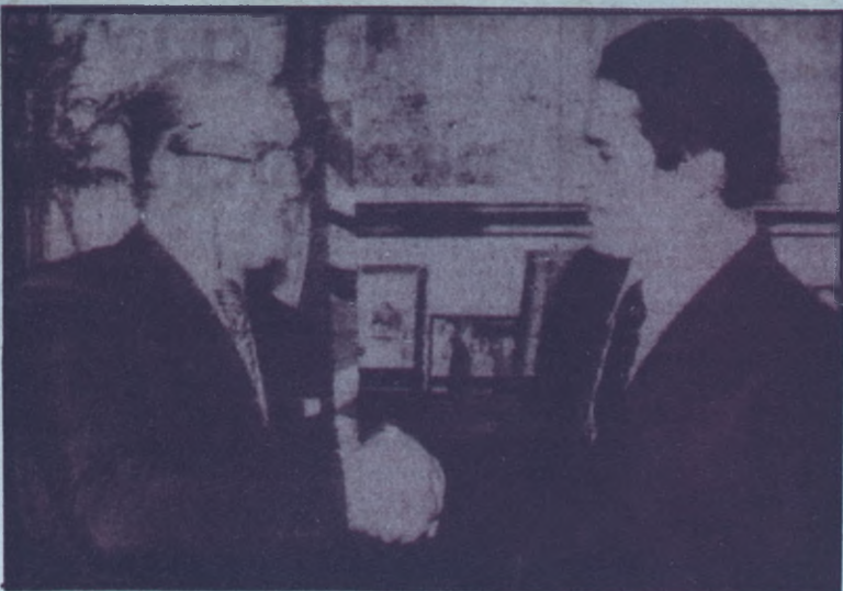
La Provincia del Darién, muy pronto dejará de ser la marginada cuando se ponga en ejecución el plan de inversión de 25,000,000.00 de Balboas en el progreso de la misma, así se lo manifestó el Dr. Alejandro Orfila secretario General de la O.E.A. al Presidente Dr. Aristides Royo, en documento que le entregará a este último durante su gira a los Estados Unidos.