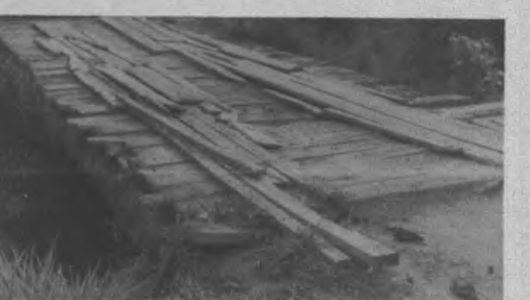
Estos son dos de los varios puentes en mal estado y que estan esperando que el MOP los repare para que no ocurra una desgracia. el puente No. 2 es el que une a los Corregimientos de Pinogana con el Real de Santamaria.

En reciente visita que realizara al Real de Santamaria y al Corregimiento de Pinogana esta dirección de la Voz del Darién se pudo percatar de lo peligroso que es transitar por unos puentes que por obra y gracias de Dios no se ha matado nadie todavía. Después de dialogar con los Representantes de ambos corregimientos, ellos manifestaron que la Dirección del MOP en la Palma les había informado que muy pronto esos puentes serían en los casos de que pudiesen ser reparados y sino se construían nuevos, por lo que ellos se sentían optimistas de que muy pronto se les daría respuesta a esta solicitud que es de carácter urgente ya que uno de los puestos mas dañados comunica al Real con Pinogana y hace ramales con otros pueblos Indígenas y