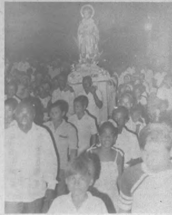
Acto de fervor Patriótico fue el que dieron los feligreses de Boca de Cupe cuando participaron la comunidad en pleno demostrando una gran lealtad por su santo Patrono "San Fernando"