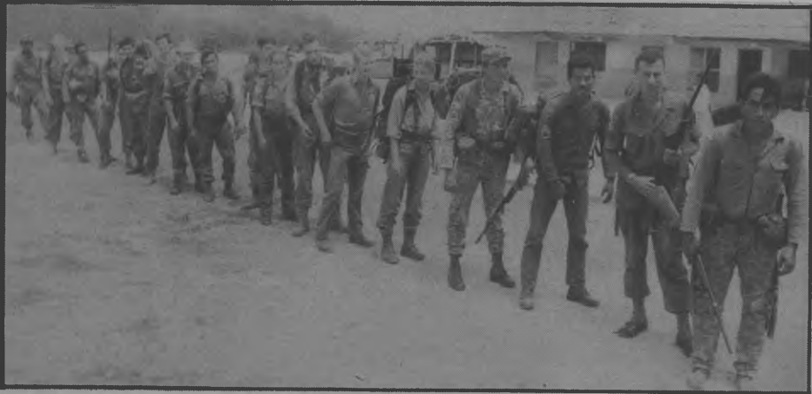
Estos son los miembros de la Operación Drake, quienes realizaron grandes descubrimientos en la Provincia, esta misión internacional está integrada por más de ocho naciones, se les aprecia en los momentos en que se disponen internarse a la espesa selva darienita, 4 mujeres acompañaron a estos expedicionarios, Europeos.