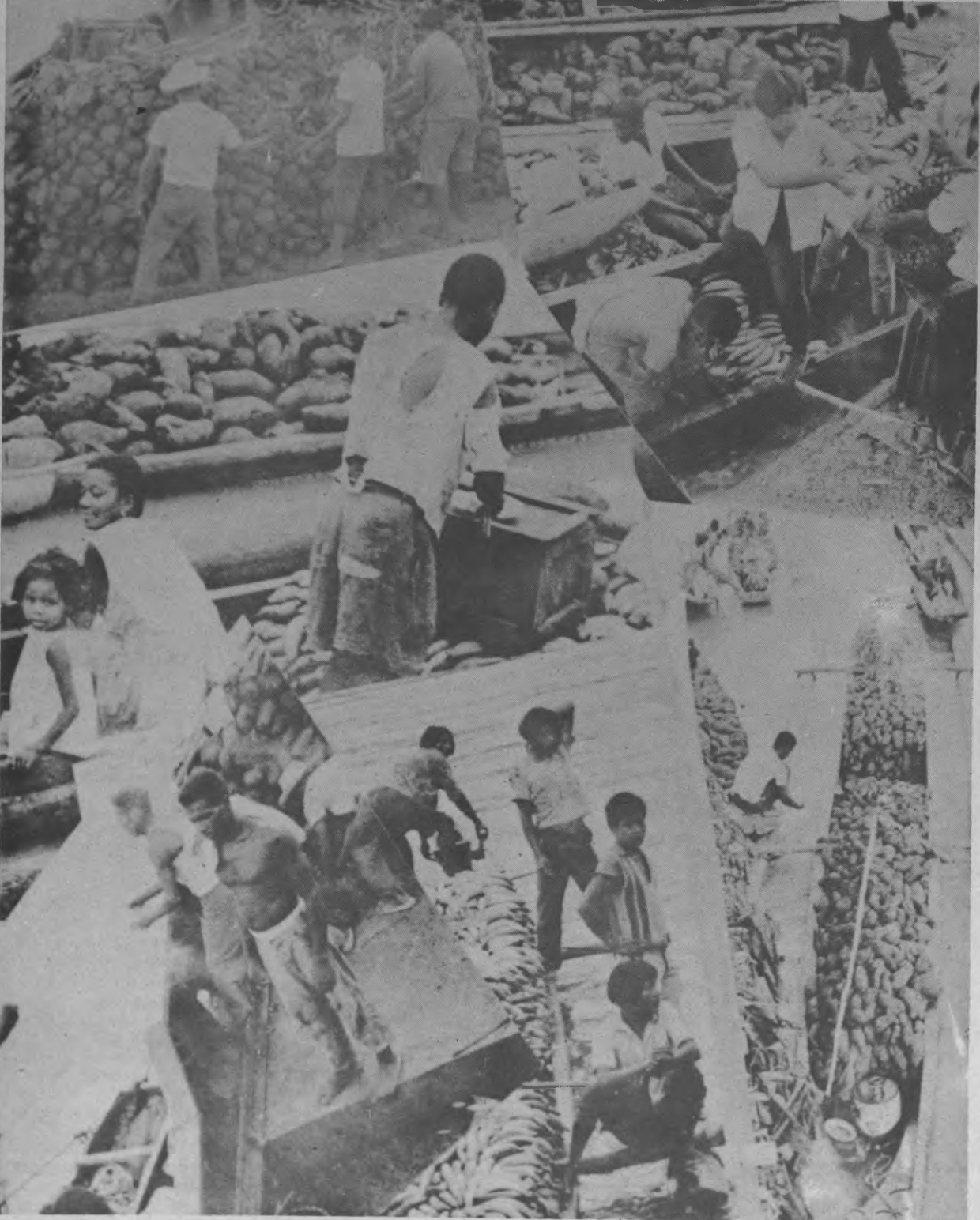
Esta gráfica nos presenta varios aspectos de como nuestros agricultores indios y libres con una esperanza de un mejor Panamá producen el Platano, Name, pero el

Sin embargo, tanto para la creación de empresas municipales que pudieran explotar y transformar la madera así como los plátanos, son necesarios además de los estudios económicos, sociales y políticos, análisis de orden ecológico los que garantizarán, en última instancia, la continuidad de estos recursos naturales renovables para que los mismos puedan ser explotados por tiempo indefinido en provecho de los darienitas y de todos los panameños por igual.