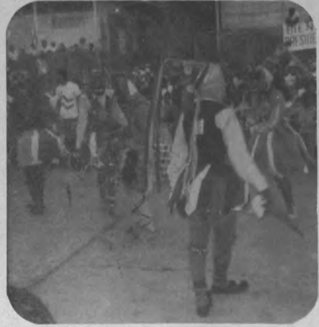
Una de las presentaciones Folklóricas que gustó mucho a los visitantes fue la de los Grandes Diablos, quienes podemos apreciar en una de sus interpretaciones de dicha danza.