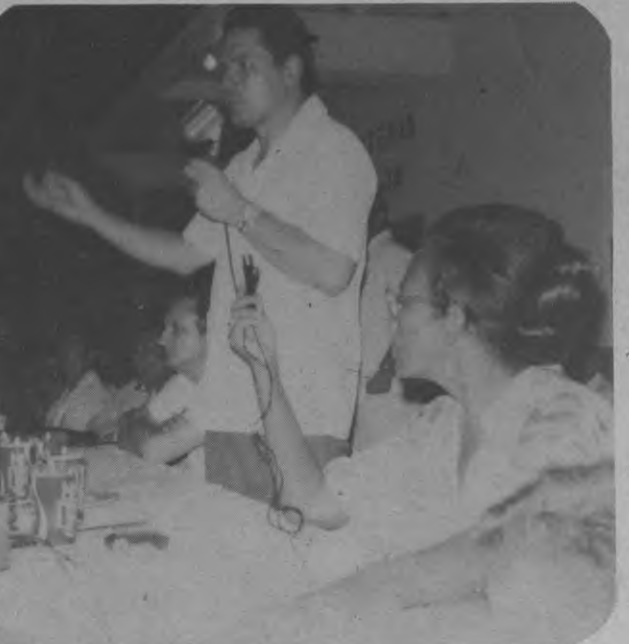
gran sensibilidad y buen humor, en la mesa principal lo acompañan el Vicepresidente de la República Licdo. Ricardo de la Espriella.