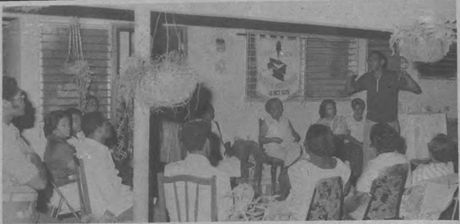
Otro aspecto en el que se aprecia al nuevo Presidente de la Asociación cuando hacia uso de la palabra, se distingue parte de los darienitas que asistieron a la misma.

Para la fundación de la Provincia en meses atrás la Asociación Darién Progresista, entregó varios grupos de sábanas a varios centros de Salud del Darién y se propone seguir donando otros implementos necesarios en nuestros centros y hospitales del Darién, por lo que se les pide su cooperación, entre los planes inmediatos y por informe presentado por los lugares que se beneficiarán con estas medidas progresista de esta Agrupación.