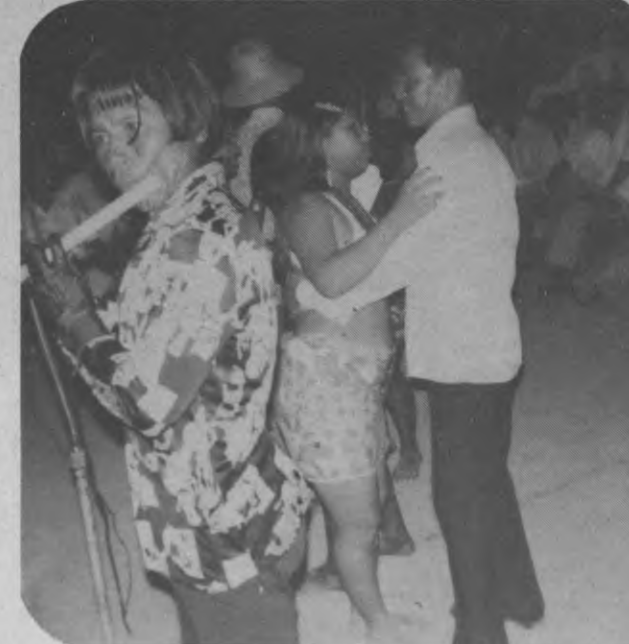
Otro de los grupos participantes fue el del sector indígena residente en el Corregimiento a quienes acompañaron en la parte musical, un conjunto de nativos del corregimiento de Sambú, cuyo