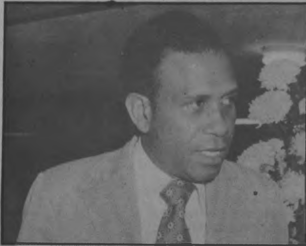
Adolfo Ahumada Ministro de Gobierno y Justicia, quien manifestó recientemente en conferencia de Prensa, que todos los Municipios del país tendrían que generar sus propias industrias y lograr sus propios fondos para hacerle frente a las demandas de los proyectos menores de los Honorables Representantes de Corregimientos. El Ministerio a su cargo por intermedio de la Digatedcom colabora con los Municipios que así los solicitaran reforzando la ya existente colaboración.