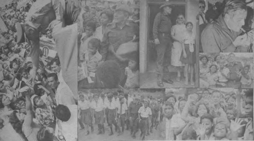
Estas gráficas fueron tomadas en su última visita que efectuara al Darién, en su condición de Jefe de estado, Darién siempre recuerda sus palabras de alimento y hoy queremos recordar uno de sus últimos mensajes Revolucionarios Pronunciados en La Palma.