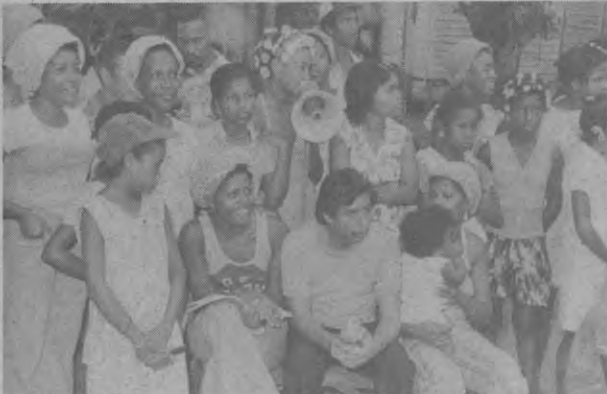
Aquí la Barra de Boca de Cupe dándole animo a su equipo que le gana en un final cardiaco a la seleccion de Pinogana.