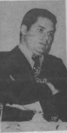
DR. ARISTIDES ROYO

7. El Partido orientará la proyección histórica de sus actividades en la perspectiva de lograr una sociedad moral y patrióticamente fortalecida, en la que se consoliden valores de auténtica equidad, confraternidad y solidaridad humanas. El Partido considera necesario lograr estos objetivos al tiempo en que desaparezcan los últimos componentes del enclave colonial. ■