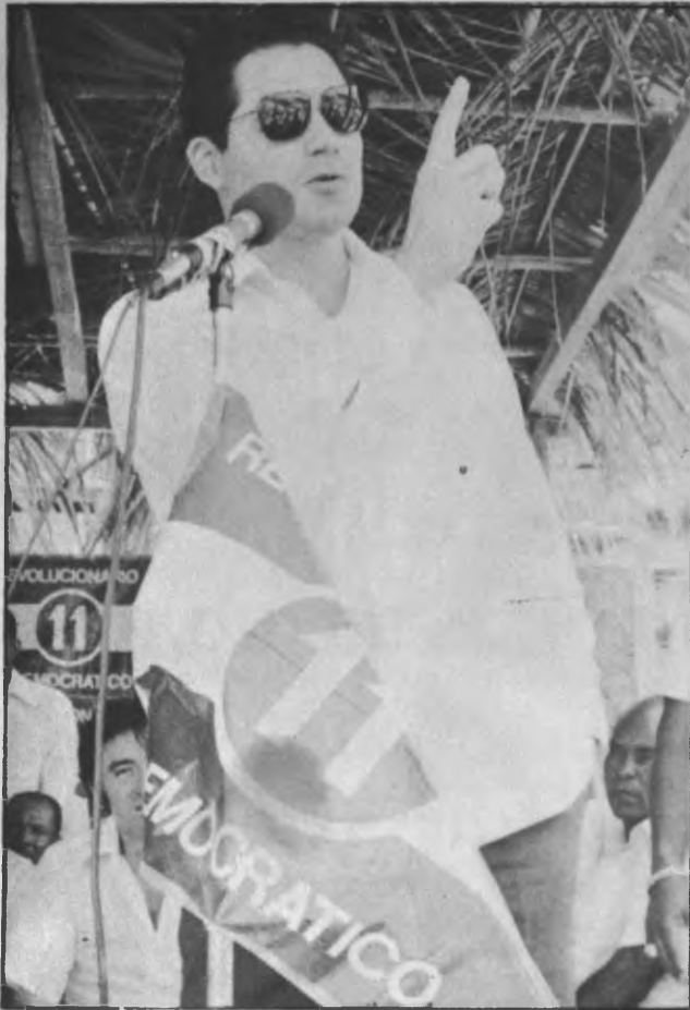
EL 10 DE OCTUBRE ENTRAREMOS EN LA ZONA DEL CANAL DE PANAMA "DARIEN ESTARA PRESENTE"

Editado en la Imprenta JULIO MERCADO RUDAS