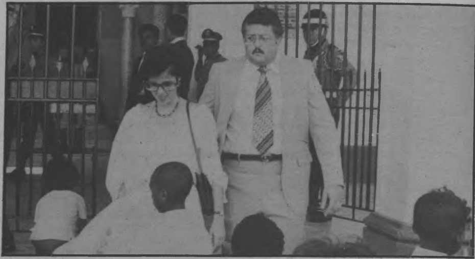
Nuevamente le correspondió al Ministro de Hacienda Ernesto Pérez Balladares, portar la bandera y esta vez fue el Corregimiento de Boca de Cupe, el Ministro Balladares es un gran amigo de los Darienitas y goza del respeto de toda la comunidad por que se le considera con cariño.