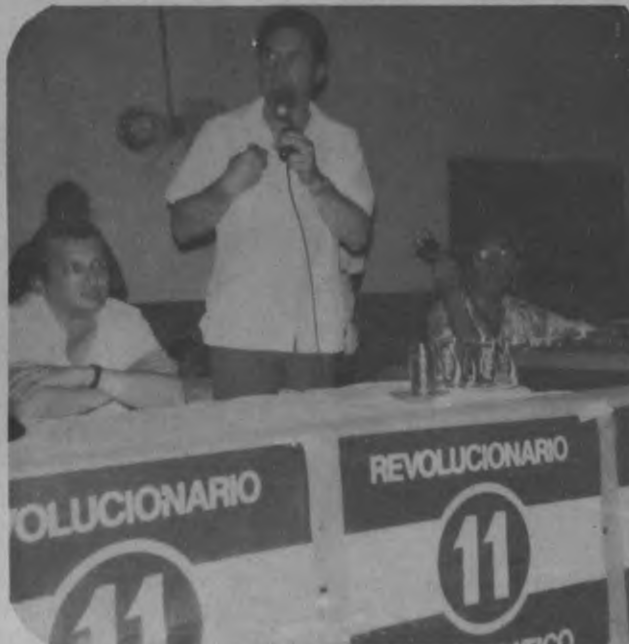
El Presidente de la República Dr. Aristides Rojo, manifiesta a la comunidad garachineña su afecto y algunas otras consideraciones de interés general, ganándose el cariño de todos los presentes por su