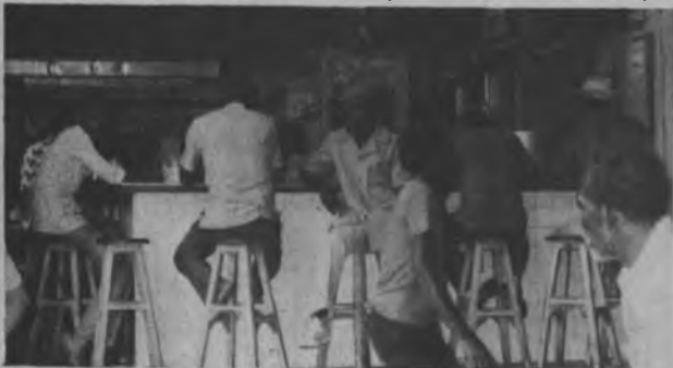
Este pequeño restaurante que opera en el Muelle Fiscal brinda servicios de alimentación a los darianitas que acuden diariamente al muelle en busca de información. Unos y otros con intenciones de mandar carga para el Darién. Aquí se venden los alimentos a precios populares especial para los que trabajan en el muelle y sus alrededores.

El muelle fiscal de Panamá, está siendo reparado para garantizar seguridad a los usuarios. Esto se desprende de los trabajos que se están realizando por