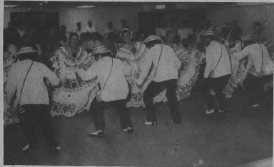
Sabemos que el Darién es una potencia en el folklore, nuestros bailes típicos, serán promovidos en la provincia para 1981, podremos presentar con orgullo de los darienitas la Temporada de Verano, con un Conjunto Típico, netamente de la provincia.

R— Precisamente, la creación del Comité de Cultura del Darién tiene como objetivo de que exista una actividad permanente, un organismo permanente en la provincia, por eso nosotros ese comité lo orientamos desde acá, estamos en contacto y atendemos las necesidades que ellos vayan planteando sobre todo con instructores. Esto nos permite a nosotros tener gente organizada, y orientada participando y activando la vida cultural de la provincia. Esa es la importancia que nosotros le vemos a estos comités. Ahora bien, nosotros en estos casos lo que estamos haciendo también en esas provincias en donde tenemos problemas de movilización como Bocas del Toro por ejemplo; ya el Darién no estará tan aislado como lo está Bocas del Toro, y lo que nos permitirá una incursión más