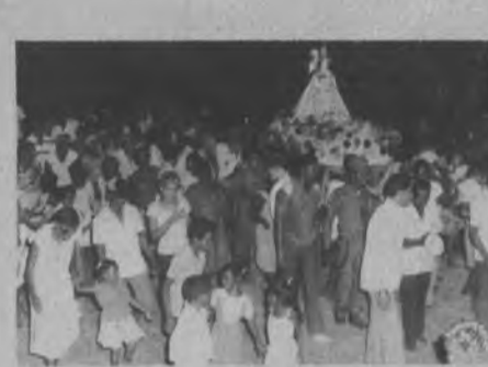
La Virgen de la Candelaria, del Corregimiento de Pinogana, cuando era paseada por sus fieles durante la procesión en su honor, cabe destacar que el fervor religioso quedó demostrado cuando cientos de moradores acompañaban a su santa patrona.

El Corregimiento de Pinogana celebró las fiestas patronales de la Virgen de la Candelaria, con júbilo y fervor religioso, durante dos días en el que los visitantes de otros corregimientos y moradores de la comunidad olvidaron sus penas y el alto costo de la vida, motivado por la inflación mundial, para dedicarse a la celebración de sus patronales, en donde se presentaron riñas de gallo, competencias deportivas y bailes populares.