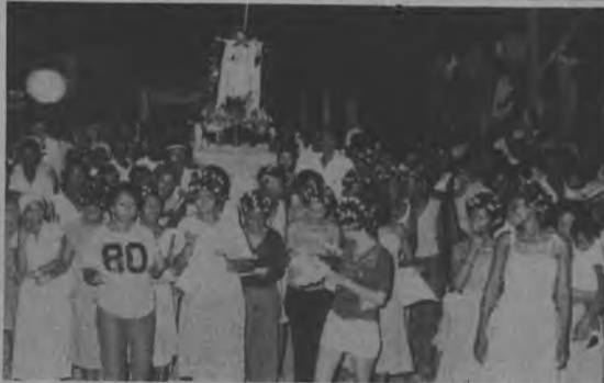
San Francisco, Santo Patrono de la Comunidad de Yaviza fue honrado por todos sus habitantes quienes le rindieron tributos durante la procesión dedicada a su imagen durante el día 12.