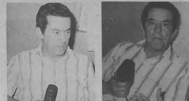
Nosotros trataremos siempre de cumplir con los moradores de la Provincia del Darién, en todo lo que nuestra Institución les pueda servir.