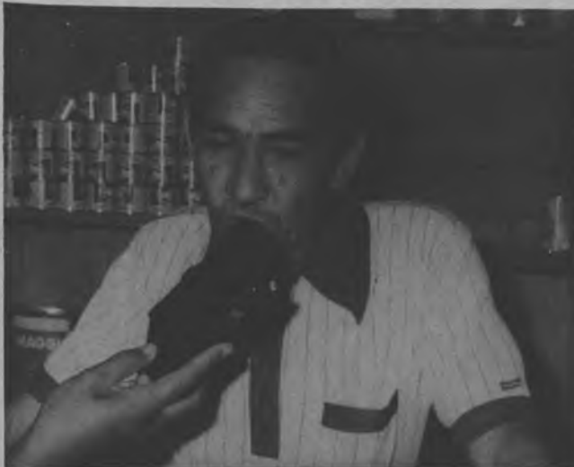
En realidad una de las metas impuesta por esta Junta Comunal es vender los productos a un precio más justo y que puedan pagar los consumidores.