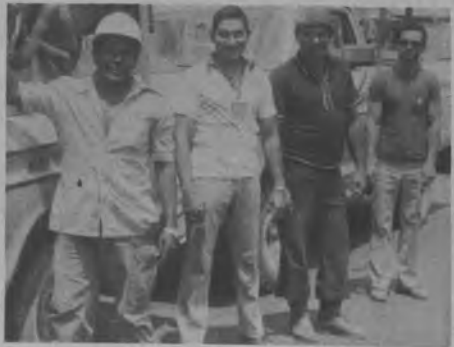
Esté equipo de héroes anónimos fueron los que hicieron posible que cientos de darienitas pudiesen asistir a la reunión que tenía el presidente Royo en la Comunidad de Santa Fe, ellos como un darienita más prestaron sus servicios profesionales sin pedir nada y sacrificando muchas cosas, para que todos pudieran asistir a respaldar al Presidente de la República Dr. Aristides Royo.

La Voz del Darién y la Coordinación de Divulgación del Consejo Provincial, cubrieron en forma exclusiva la gira que realizó el Presidente de la República Dr. Aristides Royo a la Provincia del Darién, reunión de trabajo que se realizó en la comunidad de Santa Fe, del Corregimiento de La Palma, en la que participaron los Ministros de Estado, los Directores de las Instituciones Autónomas lo mismo que todos los Honorables Representantes de Corregimientos, Miembros de la Junta Técnica y pueblos en general.