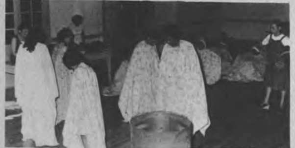
El Teatro será una de las metas para impulsar en la provincia, ya que sabemos que ésta tiene elementos idóneos que con un poco de apoyo puede lograr que el teatro sea uno de los elementos sobresalientes, impulsados por el INAC.

R— Yo tengo muy buenas noticias para el Darién.