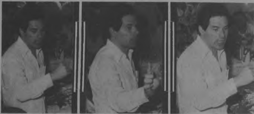
Gráficas del Señor Presidente Dr. Aristides Royo, en las varias intervenciones que realizó.