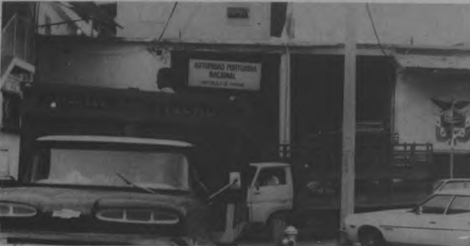
Fachada del Muelle Fiscal de Panamá, lugar en donde llegan todos los barcos que proceden desde todos los puntos del Darién con carga para la capital. Uno de los productos que transportan los barcos de cabotaje podemos mencionar como la madera, fiamé, arroz, maíz y plátanos, en el mismo orden y en primer plano se distinguen los carros que se dedican a transportar plátano traído de la provincia hacia los mercados locales.

funcionarios de la autoridad portuaria que preside el Capitán Pablo Durán. La Voz del Darién, se apersonó al muelle fiscal con la finalidad de conocer de cerca, denuncias formuladas por dueños de barcos y usuarios, quienes