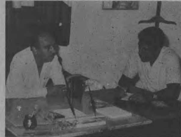
Señor Echeverría, agradezco a este medio la oportunidad que me brinda para dirigirme a todos los Moradores de la provincia darienita, reiterándole que el Darién siempre ha sido una de nuestras preocupaciones en lo que a programaciones culturales se refiere, pero que la dificultad del transporte nos hace difícil volcar todo nuestros esfuerzos para esta provincia, que sabemos está llena de grandes valores artísticos y que para el próximo año estaremos presentándoles en las temporadas de verano de 1981.

propia comunidad. Porque de acuerdo con el Instituto Nacional de Cultura, no sólo somos una entidad para presentar espectáculos, sino para estimular la participación en el arte de los asociados de la comunidad de todos los panameños, descubrir los talentos y traerlos a la propia provincia, para que cada provincia sea autosuficiente en este sentido. Y esto no quita que cuando haya las condiciones de vida, nosotros también presentaremos espectáculos de aquí de Panamá en la provincia.