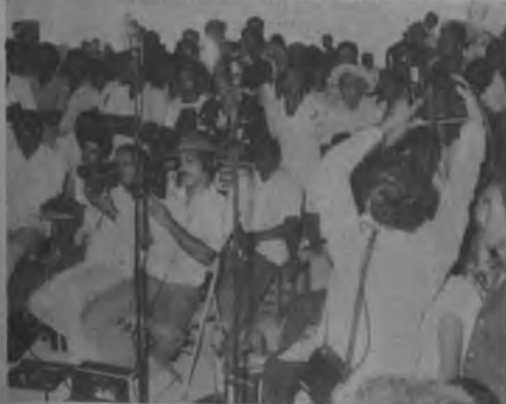
La Prensa Nacional e Internacional, cubrieron la gira del Presidente Royo, está gráfica no puede ser más elocuente del gran sacrificio de estos esforzados héroes anónimos, en la parte de atrás se aprecia a la Ex Gobernadora de la Provincia Olivia Othón.