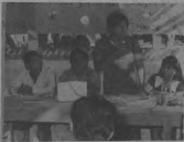
La mesa principal del Congreso, en quienes recayó todo el peso del mismo, demostrando tener capacidad y eficiencia y quienes se ganaron el respeto y la admiración del pleno de los asistentes.

Otro de los temas presentados que fue motivo de gran discusión fue la tala de madera por parte de los Latinos (Hombres Blancos) quienes sin ninguna misericordia según lo manifestaron sus dirigentes,