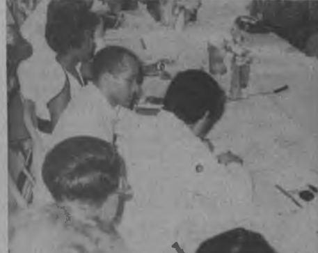
Don Basilio Macre Gobernador de la Provincia, cuando intercambiaba opiniones con el Presidente de la República Dr. Aristides Royo, con relación al tema que se estaba tratando en esos momentos.