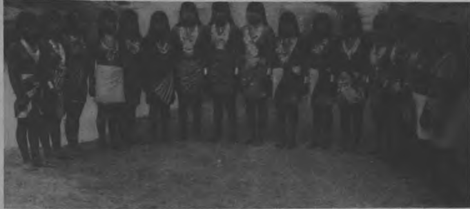
Este lindo ramillete de flores, era parte del Comité de Recepción durante los días del Congreso.