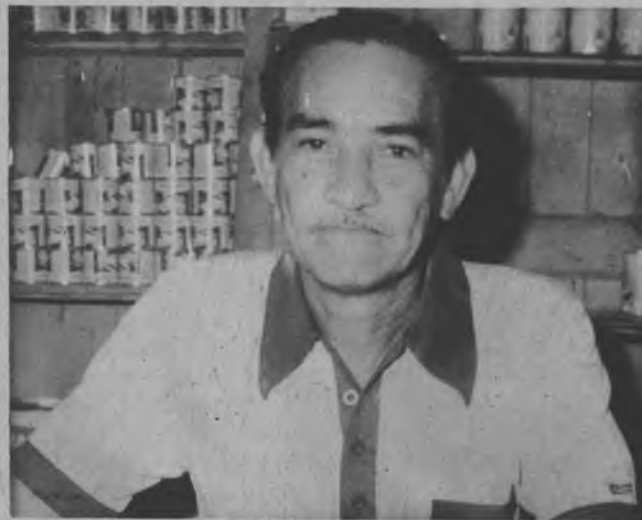
Este local en donde estamos ubicados actualmente no llena los requisitos por lo que estamos haciendo las gestiones con el H.R. Bristán, para construir lo más pronto posible un kiosco para la Junta Comunal.