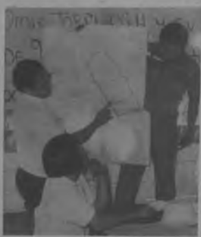
El Representante del Ministerio de Hacienda y Tesoro Departamento de Catastro, cuando explicaba por medio de un mapa los lugares que según los estudios ya finalizados estarán ubicadas las Tierras que serán Reserva Indígena.

y moradores de otras comunidades, quienes se unen a los bailes programados. Estas festividades que duran de dos a tres días, en donde todos celebran el éxito logrado durante sus deliberaciones, custodiados por los policías voluntarios que cuidan el orden y la disciplina. En fin, estos Congresos indígenas unen a toda la familia Chocoe, quienes viajan desde todos los puntos, en barcos o piraguas, siempre para cumplir con un compromiso de sus antepasados, ya que todo lo que ellos realizan y la celebración de estos Congresos son tradiciones que datan de cientos de años.