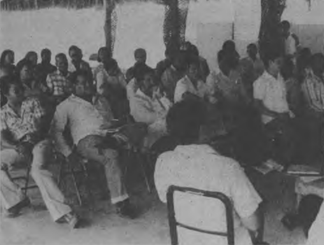
Un aspecto de la concurrencia entre los que se encontraban todos los 19 Honorables Representantes de Corregimientos, Miembros de la Junta Técnica, durante el Consejo de Coordinación celebrado en La Palma con la presencia de los Ministros de Educación y el de Planificación y Política Económica.