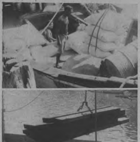
Esta gráfica es una muestra palpable de la realidad vivida por los agricultores, los dueños de barcos, lo mismo que los comerciantes, el muelle ha quedado demasiado chico para la cantidad de movimiento existente, la madera y el maíz lo mismo que los otros productos que produce la tierra hacen de este gran muelle una estructura completamente obsoleta.