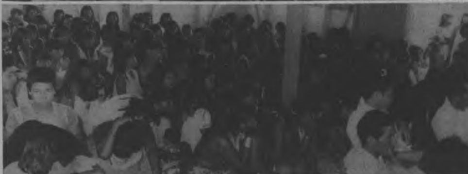
Se aprecia a los cientos de indígenas quienes participaron en todas las deliberaciones, en la parte de abajo se aprecia igual número pero en este caso de mujeres, quienes en esa forma respaldaban a sus maridos.