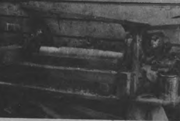
Este es el torno con el cual hago todos mis trabajos, lo hice con un motor de carro el cual lo dividí en dos.