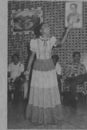
Los artistas para el próximo verano 81, serán todos de la provincia del Darién, estamos formando los grupos para detectar a los valores artísticos, nuestros funcionarios, siempre estarán visitando a la provincia durante este año para poder sentar las bases necesarias y lograr que este programa presentado en el Darién sea de la provincia.

ustedes conocen, de transporte de comunicación con esa provincia, nosotros hicimos el año pasado la primera incursión en Darién, mandando por delante a unos funcionarios del INAC, que hicieron contacto con la comunidad, y allí crearon el primer comité de cultura de la provincia de Darién. Aprovechamos también esa oportunidad para llevar un grupo que