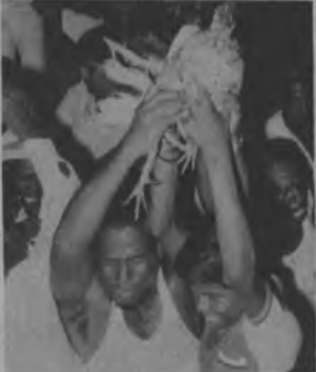
Las riñas de gallos estuvieron a la orden, como una tradición en el Darién acudieron cientos de gallos venidos de los Corregimientos vecinos entre ellos El Real, Pinogana, Boca de Cupe, La Palma y Chepigana entre otros.