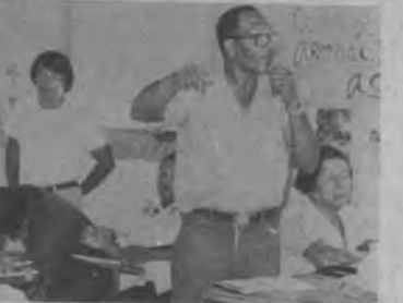
El Director Provincial de Educación, Fernán Díaz, en los momentos en que se dirige al Congreso, informándoles que su dirección tomaría todas las acciones en el caso de los Educadores que no cumplieran con sus obligaciones.

mente se procedió a la escogencia, la que sería por mayoría de votos, en donde, los dos candidatos se pararon frente a la sala del Congreso en la parte de afuera y todos los que simpatizaban con cualquiera de los dos candidatos, se colocaba en la parte de atrás del mismo. Notándose que estas votaciones democráticas eran importantes porque las personas escogían a su candidato sin presión y a la vista de todos. En