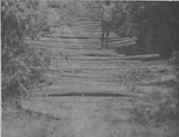
Dentro de las prioridades más urgentes por el MOP, está la de reparar todos los puentes en mal estado que hay en el corregimiento de EL REAL y en otros pero la falta de equipo hace imposible tal labor en beneficio del darenita.