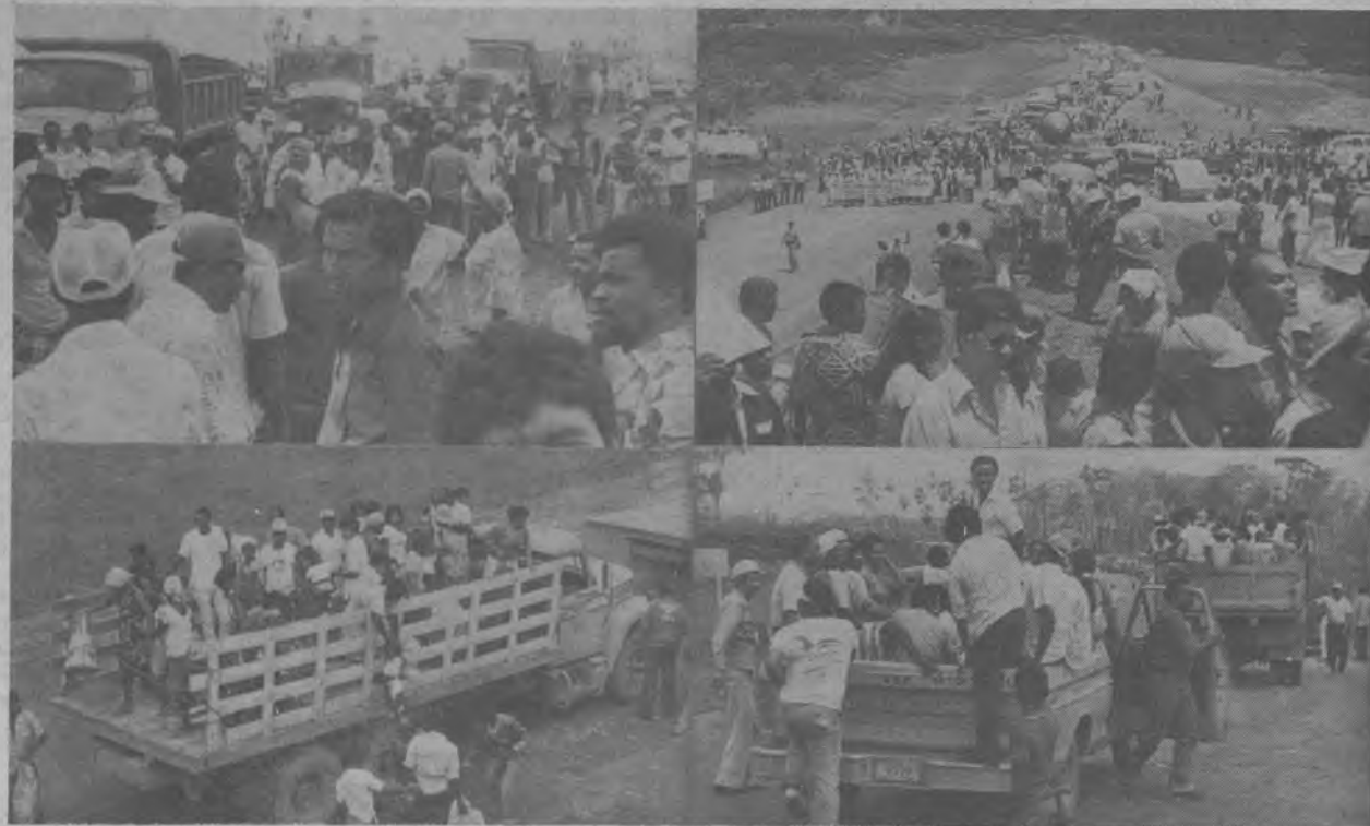
Este mosaico fotográfico, nos ofrece la oportunidad de apreciar en la forma como llegaban los darienitas y amigos del Darién a los actos de Inauguración de la Carretera Panamericana. En ella se aprecian a los Honorables Representantes del Corregimiento y pueblo en general.