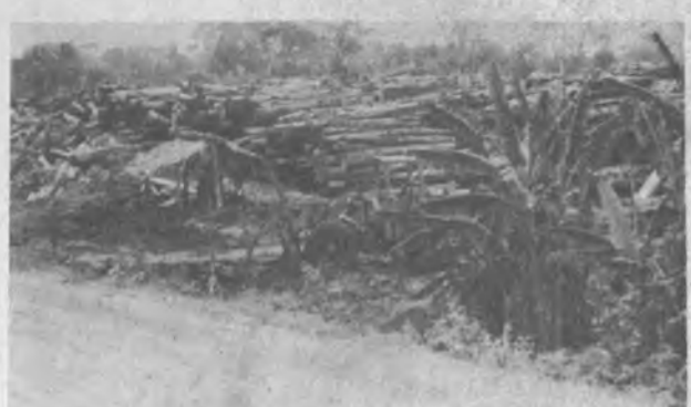
El Bayano produjo millones de pies de madera, hoy el Darién está a punto de ser invadida por lo madereros industriales, en esta gráfica se puede apreciar la cantidad de árboles cortados en tucos que esperan ser trasladados al mercado. La Voz del Darién, solo les pide que cuando corten un árbol siembren otro.

Después de Bayano, tendrán los madereros que entran al Darién, que hoy por hoy es la más rica en todo el territorio nacional, pero tristeza nos causaría, que cada vez que cortaran un árbol no se reemplazara el mismo. Nuestras autoridades debieran de mantener un control relacionado con la tala de árboles y no permitir esa tala indiscriminada. La Voz del Darién se mantendrá en estado vigilante, para no permitir la misma denunciara a los infractores.