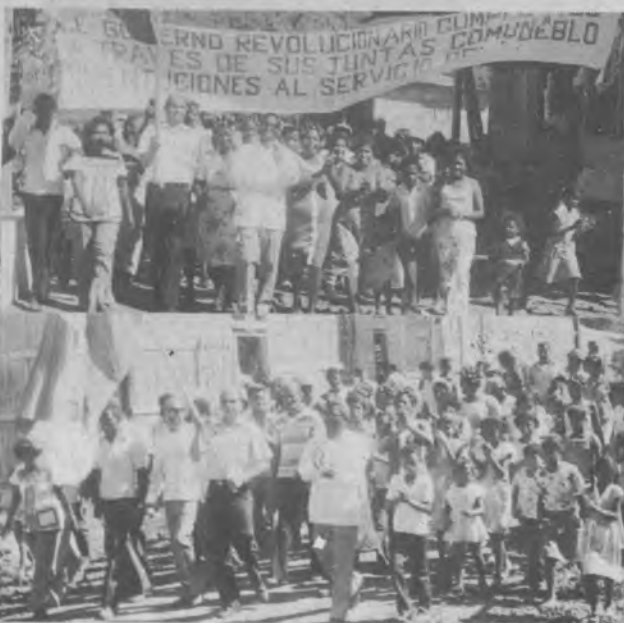
También la comunidad celebró con fiestas el acto de inauguración y en esta secuencia apreciamos al Vice Ministro Espino, portando de la alegría como un homenaje a la inauguración del muro de Chepigana, las mismas es muestra de un pueblo agradecido con el gobierno que le brindó respaldo a sus inquietudes.

podían utilizar gracias al MOP y a su Ing. Víctor Córdoba, quien junto con el personal de esa Institución y el Pueblo Chepigano se unieron y realizaron esa obra que representa uno de los logros más codiciados para ese corregimiento.