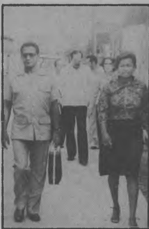
El Ministro Ortega, camina junto con la juez de Trabajo del Darién, para realizar una visita al despacho antes mencionado.

corregimientos. También ofreció brindar su respaldo para capacitar a las secretarías y brindar asesoramiento a todas las instituciones que así lo solicitaran.