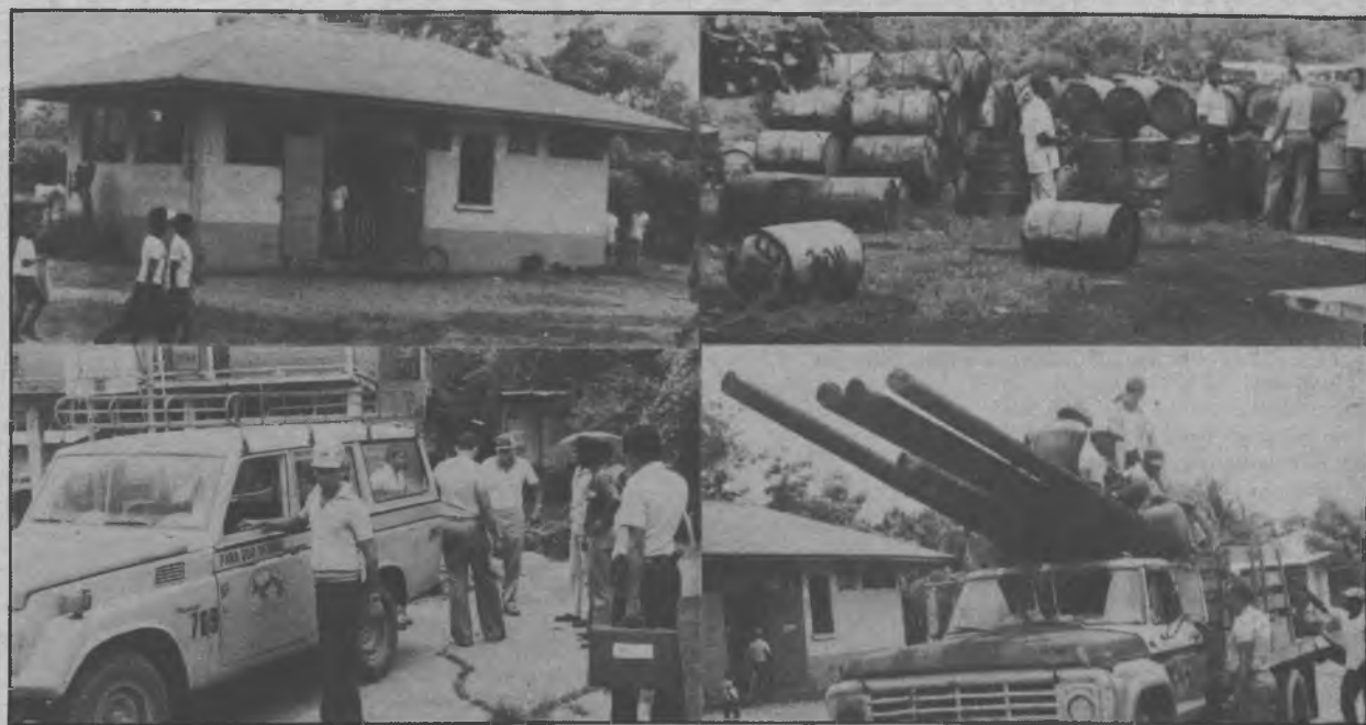
En este mosaico fotográfico, apreciamos varias secuencias de las actividades que viene realizando el IRHE en el Darién, estas fotos fueron tomadas en Garachiné, y se aprecia a los trabajadores de la institución coordinando

Una sorpresa, tendremos dentro de poco y la misma causará tanta alegría por ser la primera vez que algo sucede y la provincia en general celebrará este acontecimiento.