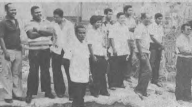
En esta gráfica se aprecia a una parte de los invitados moradores del Darién que hicieron acto de presencia en los actos mencionados entre ellos funcionarios de Gobierno y Honorables Representantes de corregimiento.

En virtud de este histórico acontecimiento, lo cual marca un hito del progreso darienita, es necesario que lo veamos también, como un compromiso ineludible, para con nosotros mismos.