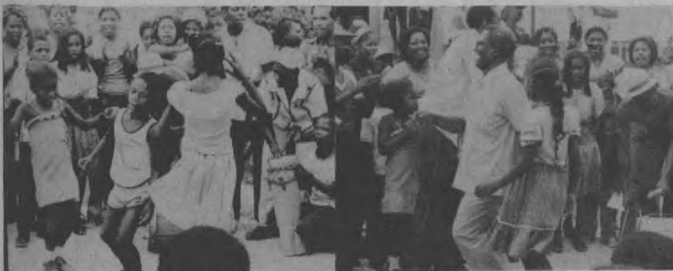
La cumbia tradicional en la comunidad es interpretado por niños de la comunidad de Chepigana y el H.R.Juan Berrio en honor a la inauguración de la Universidad popular del Darién.

La Dirección de este periódico, les promete hacer todos los contactos necesarios para poder lograr el visto bueno del Consejo Provincial de Coordinación a fin de poder aumentar el personal que es necesario para el próximo año fiscal y de no ser posible el respaldo antes mencionado.Desde ya podemos anunciar que solamente saldremos con dolor nuestro, durante este año de 1980, y nuevamente les decimos que la razón es la falta de personal, equipo de movilización y de trabajo para poder en esa formar cumplir con ustedes nuestros lectores y cumplir con nuestra Provincia que tanto nos necesita. DARIEN ES LA RESERVA DE LA PATRIA.