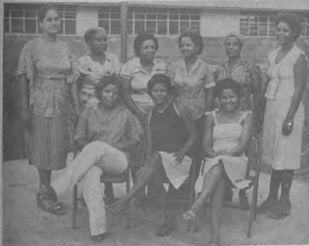
En este grupo de damas realeñas descanso toda la organización de las patronales de la Virgen de La Antigua, ellas integrantes de la Junta Directiva del Club de Damas Catolicas en compañía de las demas damas de la comunidad organizaron todas las actividades programadas para esos dos días. La Voz del Darién las felicita por la organización en honor a la Virgen de la Antigua.