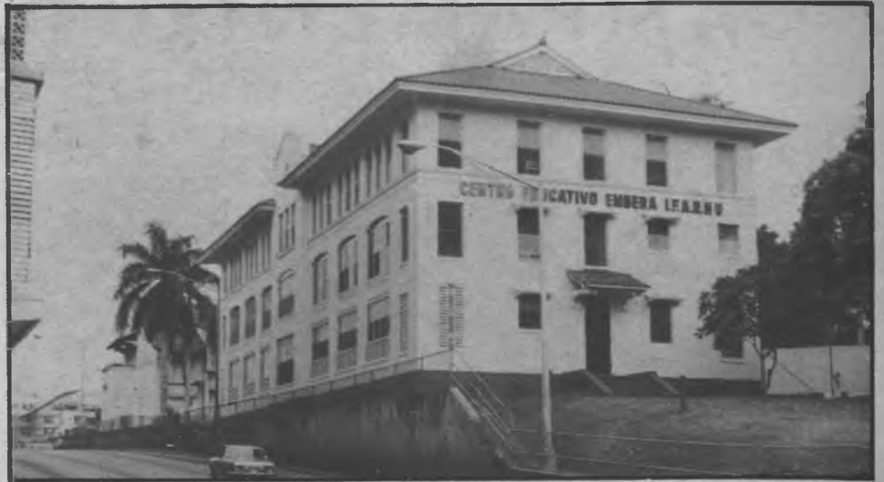
Por instrucciones del Presidente Dr. Aristides Royo, el Instituto para la formación de Recursos Humanos (IFARHU), inauguró recientemente el Centro Educativo Embera, casa ubicada en al Avenida de los Martirés frente al Palacio Legislativo. (Pasa a la página 8).