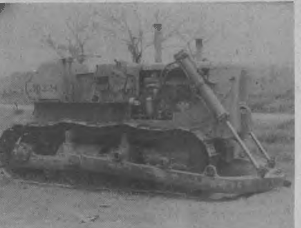
La falta de piezas para reparar el equipo del MOP, hace muchas veces que pareciera que la institución no hace nada pero la verdad es que si le metieran la mano de verdad se repararían mucho equipo pasado que por la falta de una pieza está en abandono total.