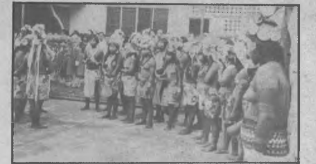
Los Indígenas Chocoes celebran danzas en honor a la inauguración del Centro antes mencionado.

General de Brigada Omar Torrijos Herrera, inició las gestiones para lograr un lugar apropiado para la casa Embera y no fue hasta después de los tratados Torrijos - Carter y al pasar a Panamá varias áreas localizadas en la Zona Del Canal, que se logró la consecución del edificio en donde hoy está ubicada la Casa del Indio, promesa de este Gobierno Revolucionario que un día nació para hacer justicia entre el pueblo y el Indio panameño.