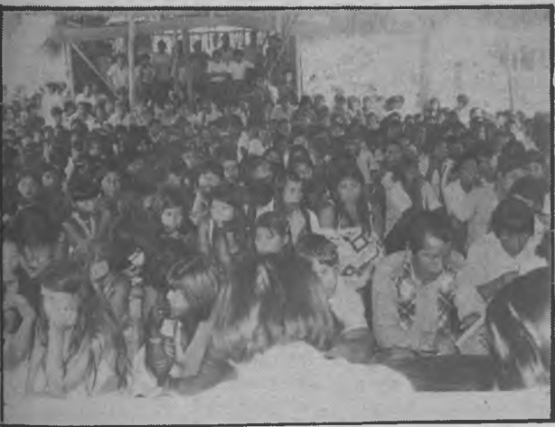
Gran parte de los Jefes y sus esposas en el congreso indígena, en donde se apoyó al partido Revolucionario Democrático P.R.D. y sus candidatos Mezúa y Leneé.