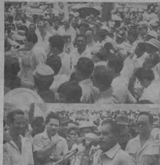
Miles y miles de personas se trasladaron al Darién para presenciar la inauguración de la Carretera, Panamericana, lo mismo hicieron cientos de darienitas que llegaron en piraguas, botes y carros, al lugar de la inauguración en estas fotografías tomadas por Ortega, el pueblo se confunde con los funcionarios de este gobierno en la celebración de lo que muy pronto será la unión entre Panamá y Colombia.