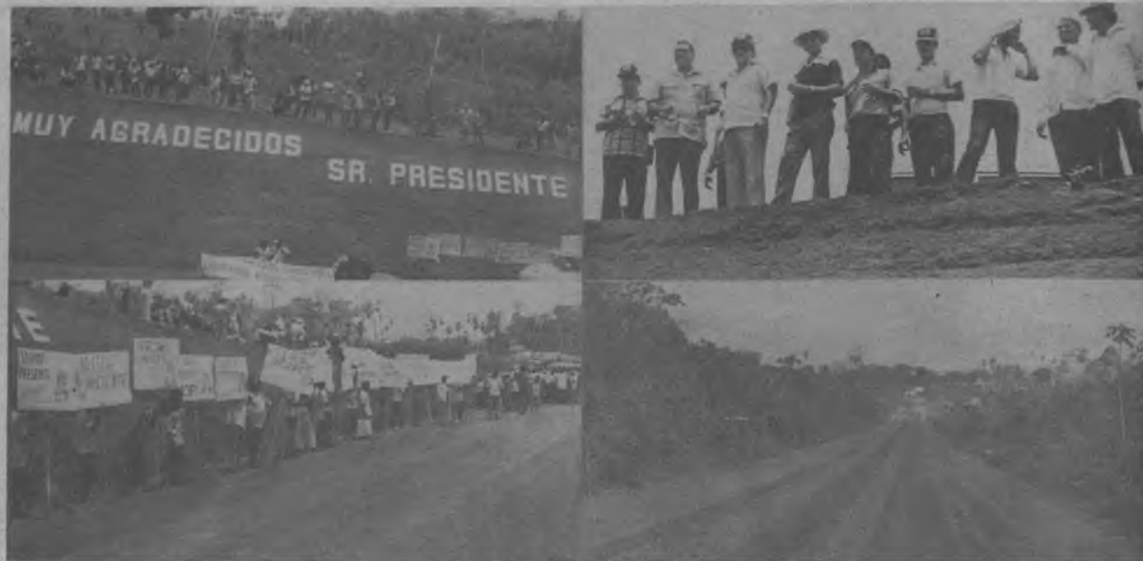
Gráficas de diferentes aspectos en la inauguración de la carretera Panamá Darién. Letreros de agradecimiento se leían por todas partes, tal como se demuestra en esta secuencia.

Aunque un poco tarde la Voz del Darién, quiere reproducir en gráficas los distintos aspectos de la inauguración de la Carretera, que desde ya une a la Provincia del Darien con el resto del país. Esta carretera, será de gran beneficio para los darienitas, quienes siempre se vieron privados de utilizar el transporte terrestre, sistema más rápido para transportar sus productos los que perdían por miles en el caso del Plátano que se produce durante todo el año, el aguacate durante su temporada y otros productos que ya no se perderán, gracias a la construcción de la carretera, la que le correspondió declarar inaugurada al Presidente de la República Dr. Aristides Royo. Las Comunidades que se beneficiarán con esta carretera directamente, podemos mencionar Santa Fé, Los Monos, Río Iglesia, Metetí. Esta dos últimas comunidades son habitadas por Colonos y la Comunidad de Yaviza, en donde finaliza el tramo de la carretera del Darién. Destacando que los Corregimientos de El Real, La Palma, Pinogana, Boca de Cupe, Yape, Unión Chocó, Paya, Púcuero, se beneficiarán de esta gran obra. creación de este gobierno y respaldada por todo el pueblo darienita