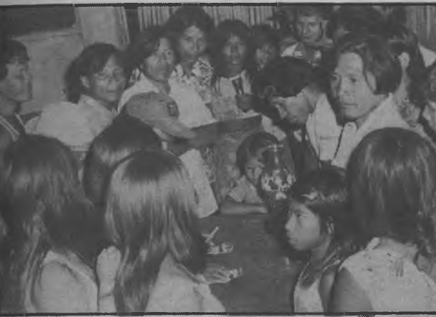
Los dirigentes y las esposas reciben indicaciones de los Caciques en la forma correcta para votar en las elecciones del 28 del venidero.

Durante la celebración del Congreso Indígena Chocoe, celebrado en días pasados en el Corregimiento de Sambú, comunidad de la Chunga, el pleno de los 1,000 delegados representantes de todas las comunidades chocoes del Darién, respaldados por los tres (3) Caciques, decidieron