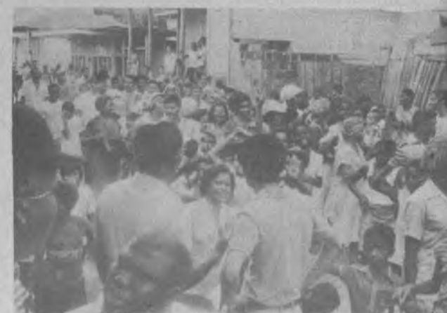
Después de ser proclamados los triunfadores, los mismos fueron acompañados por sus seguidores en una alegre tuna por las principales calles del Corregimiento de Yaviza.