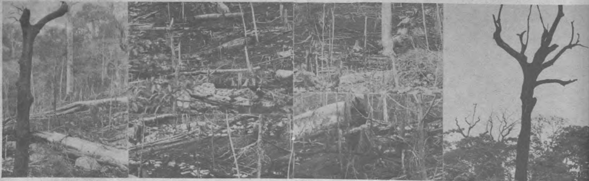
En este mosaico fotográfico podemos apreciar lo que nuestros ojos vieron en la inauguración de la carretera, el crimen mas grande que se puede cometer con la fauna y la

flora al usar la quema para sembrar, que arraza los árboles y destruye lo que en su paso se pone. Para una prueba tenemos estas fotografías que hablan por si solas de la quema