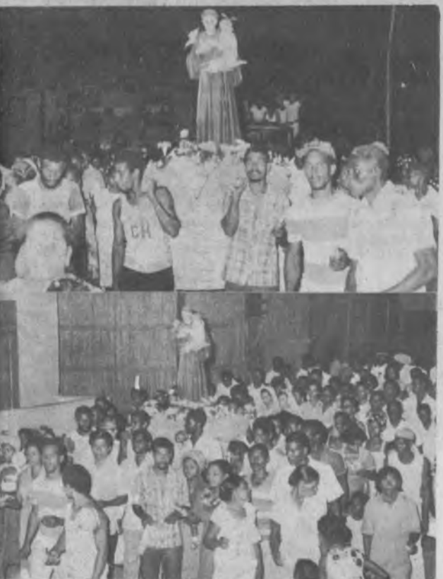
El lente de Ortega, captó este momento de fe cristiana cuando en honor al santo patrono San Antonio, la comunidad después de los actos de inauguración y dando gracias recorren las principales calles del corregimiento de Chepigana.