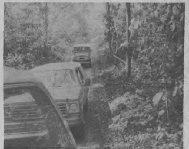
Este es el Camino de Canción a Yaviza, que solamente se rehabilita durante el Verano, para este año al 81 el Presidente Royo, prometió que ordenaría para que la rehabilitaran para verano e invierno, con beneficio para 7 corregimientos del Darién.