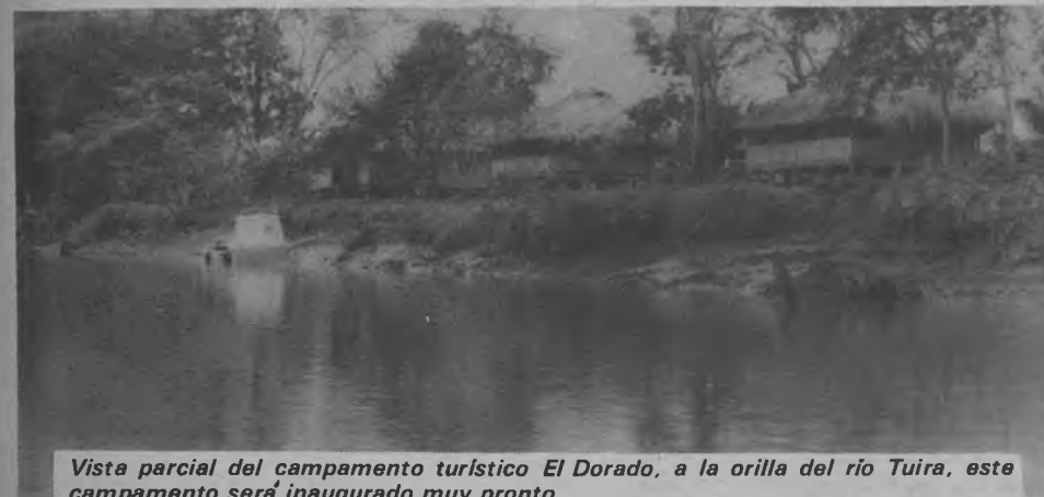
Vista parcial del campamento turístico El Dorado, a la orilla del río Tuira, este campamento será inaugurado muy pronto.

Tal como lo habíamos informado en nuestros números anteriores de la Voz del Darién, hoy presentamos una entrevista del Campamento Turístico el Dorado, ubicado en el Corregimiento de El Real de Santa María ya que uno de los fines de éste medio informativo es resaltar las actividades programadas