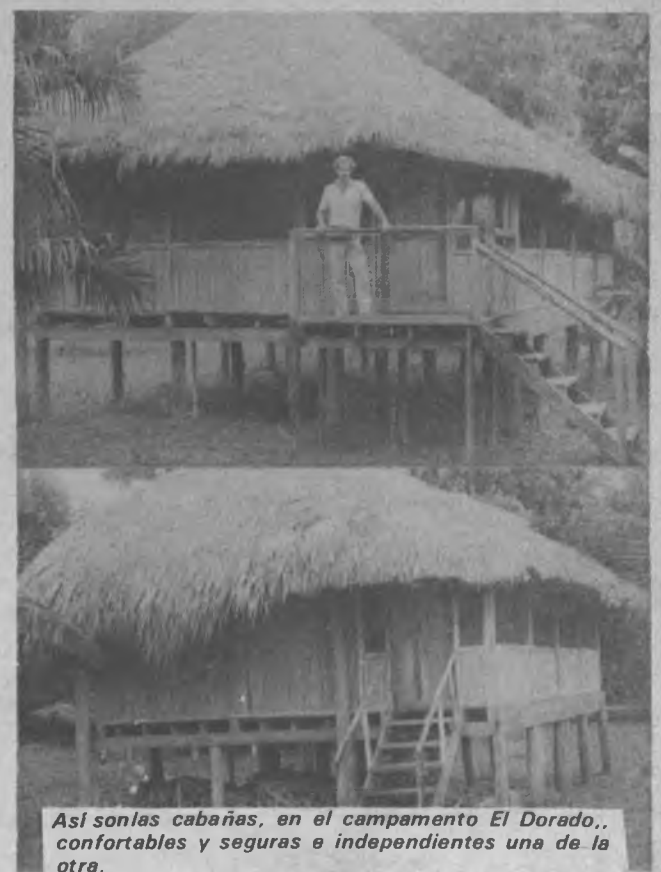
Así son las cabañas, en el campamento El Dorado., confortables y seguras e independientes una de la otra.

pero los mismos tienen que tener 6 años en adelante. UN PEQUEÑO ZOOLOGICO Contamos con animales silvestres: monos, pericos, loros, ñeques, conejos y animales salvajes como, Tigres, culebras y otros mas que están en lugares seguros para que los turistas se tomen fotografías como recuerdo.