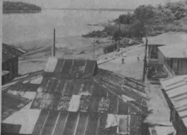
Vista panorámica desde lo alto en donde se aprecia al gran muro construido por la comunidad y el MOP, muro que retendrá las aguas del Chucunaque y permitirá que las tierras no ocupadas sean utilizadas para beneficio de la comunidad.