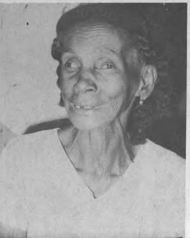
Cuando llegamos al Darién tenía 12 y prácticamente nuestros padres fundaron la comunidad de Yape, que es hoy Corregimiento.

documentos a todos los que los soliciten sobre todos los que por años de dedicación han hecho producir la tierra darenita y los que tienen sus familias y espocas panameñas. Para terminar con esta entrevista, le solicitamos a la señora Córdoba que envíe un mensaje a sus paisanos darenitas en general, ella expresó "solo les pido a todos que trabajen en conjunto y que siempre apoyen a las autoridades en beneficio de la provincia del Darién.