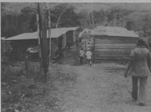
Estas barracas fueron acondicionadas urgentemente para alojar a los damnificados del derrumbe de tierra en el que perdieron la vida dos personas al quedar sus casas sepultadas bajo el lodo y de los damnificados, cuando un viento huracanado destruyó varias casas y arrancó los cines de otras.

pudieron salir rápidamente de sus hogares, era por esa razón de que cuando sucedió lo antes mencionado