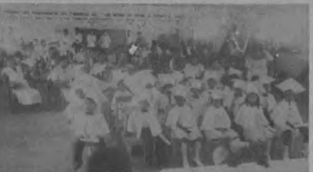
La educación en el Darién será garantizada para cuando estos jóvenes lleguen a la secundaria y sus padres puedan sentirse orgullosos de la educación que reciben sus hijos esta foto es de archivo y fué tomada en Yaviza, Distrito de Pinogana, en el 79, lo que nos demuestra que el Darién está caminando.

mediocre que reciben sus hijos, así lo ha manifestado el Ministerio de Educación quién ha tomado las