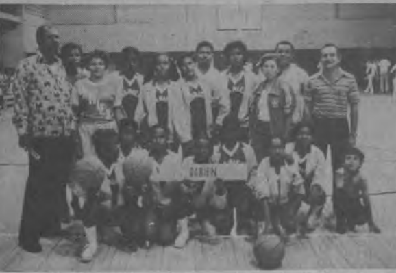
Equipo juvenil de Baloncesto femenino del Darién que participó en el Nacional.