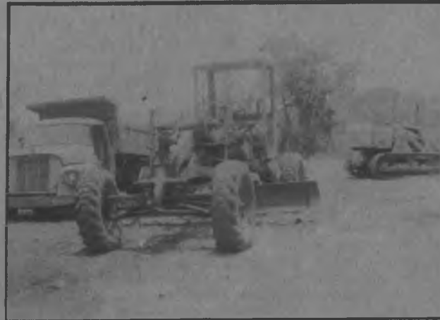
Parte del Equipo dañado y que por falta quizás de una bujía se está perdiendo con perjuicio para los cientos de darienitas que se ven imposibilitados de sacar sus productos por la falta de caminos de penetración.

Los moradores del Corregimiento del Real de Santamaría, esperan que el Ministerio de Obras Públicas inicie lo más pronto posible la reparación del equipo pesado que está ubicado en esta área del Distrito de Pinogana y que de