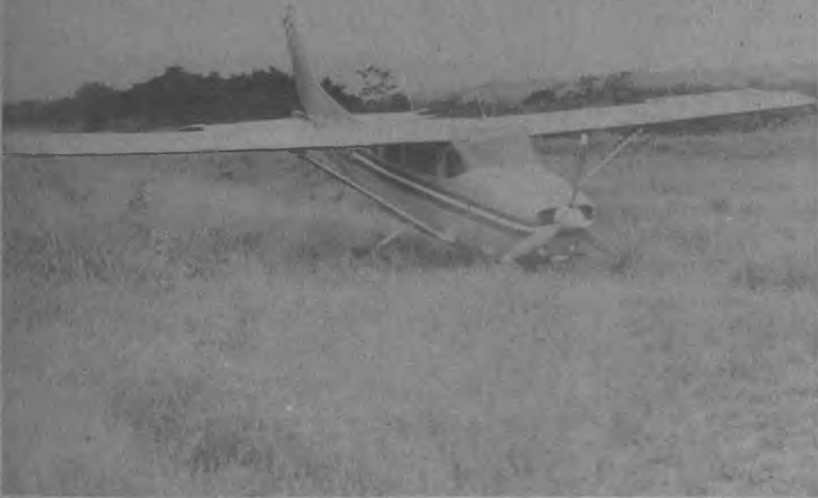
Esta es la pista de El Real de Santa María, que muy pronto será construida de Cemento, lo que permitirá que puedan aterrizar en el futuro aviones de dos y cuatro motores, con beneplácito para los cientos de residentes del Distrito de Pinogana. Es importante destacar que este avión de la Compañía TASA, ADSA y SASA, sufrió un accidente al tratar de aterrizar y por fortuna los pasajeros salieron ilesos, es por ésta razón que los aviones no quieren aterrizar en estas pistas no acondicionadas, por lo que Aeronáutica Civil tendrá que iniciar esta clase de trabajos en todo el Darién.

La Voz del Darién, para el próximo número les estará presentando un reportaje completo sobre esta gran obra que será de beneficio para el Corregimiento de El Real y Corregimientos vecinos.