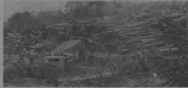
Esta gráfica es una prueba elocuente de la gran cantidad de madera que se saca del Darién, y lo más triste que los carros que la transportan hacia sus depósitos dañan la carretera y el que paga esta consecuencia es el darienita que tiene que viajar por carreteras llenas de huecos dejados por los pesados carros antes mencionados.

Son cientos de Pies de Madera lineales que se sacan por horas desde la Provincia del Darién, sin que nadie diga nada y los municipios de Chepigana y de Pinogana pero ni las gracias reciben, sabiéndolo por estos explotadores de la madera que el Darién es una de las Provincias que la naturaleza la lleno de riquezas naturales y que con un aporte económico que ellos le brinden al Darién será de beneficio General.