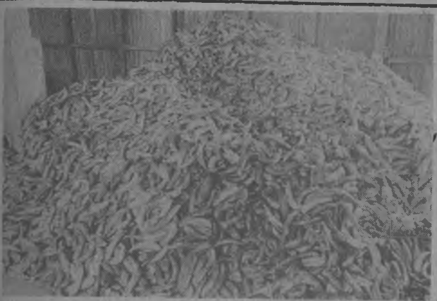
Cientos de Plátanos se pierden por la falta de comercialización, en la próxima edición de Julio estaremos presentando un reportaje gráfico de la realidad y buscar la solución a este problema.