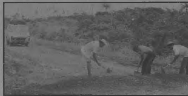
Cuadrillas de empleados del M.O.P. realizan trabajo en la carretera, en la parte de atrás espera un micro-bus para pasar. Queremos aclarar que en días pasados Crítica, publicó una noticia de que para Darién solo circulaban Chivas Gallineras ¿Cómo les quedó el Ojo?.

Los Corregimientos y Comunidades esperan pacientemente que el M.O.P., inicie lo más pronto la reparación de este equipo sino que lo reemplace por otro nuevo.