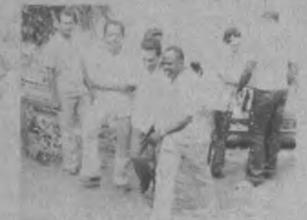
Representante del Corregimiento, abanderado oficial; ni la distancia, ni las incomodidades de transporte son obstáculos para cumplir con el Poder Popular y sus comunidades.