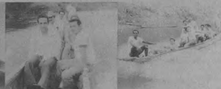
en varias secuencias se le aprecia viajando en piraguas por el majestuoso Río Tuira a cuatro horas del Corregimiento de Boca de Cupé en donde había sido nombrado por la Comunidad y el Honorable