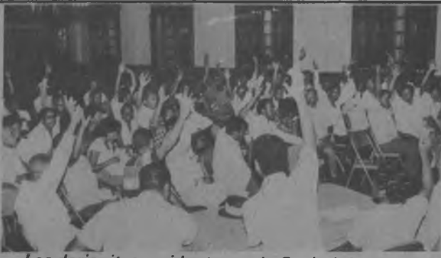
Los darienitas residentes en la Capital, levantan las manos en señal de aprobación por la atinada decisión de los Legisladores de unificar a la familia darienita.