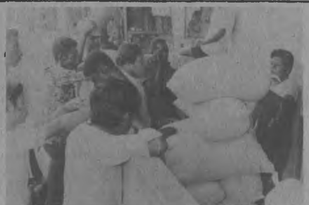
Los agricultores darienitas cuando esperan que los funcionarios del Instituto de Mercadeo Agropecuario I.M.A., les pesen sus productos granos, esta labor se realiza en los lugares más apartados de esta provincia.