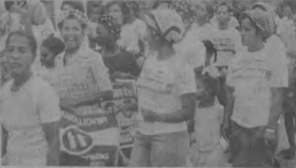
El Partido Democrático Revolucionario se fortaleció cuando en El Real de Santamaría, la familia Perredista celebró la reunión con la participación de los 19 Corregimientos del Darién, en donde tenemos Células del Partido. Para la próxima edición del mes de Junio estaremos presentando gráficamente todo lo acontecido en esta reunión que fortaleció las bases para hacer del P.R.D., el partido más fuerte que haya existido en la Provincia Darienita.