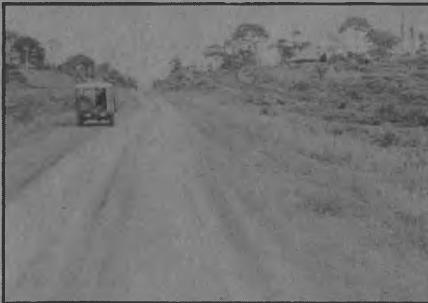
Obsérvese en esta gráfica lo parejo que está quedando la carretera Panamá Darién.

carretera está recibiendo todo el mantenimiento de esa Oficina Regional y espera que para el verano quede terminado el tramo de 27 kilómetros que divide Canción de Yaviza punto final en donde culmina la carretera Panamericana.