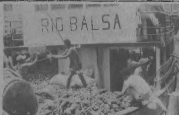
Los productos son transportados en barcos desde Darién, en esta gráfica se aprecia al Río Balsa descargando plátano, ñame, aguacates y madera.