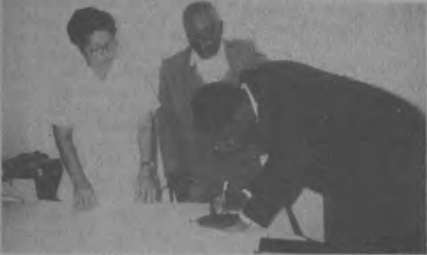
EL GOBERNADOR FIRMA