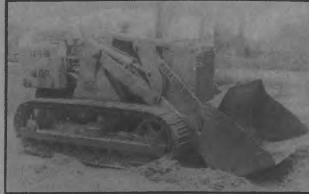
Este cargador tan necesario quizás no sea gran cosa lo que le hace falta, para ponerlo a funcionar y la comunidad protesta con justificación.

Salud, en donde los Estudiantes pudieron ampliar sus conocimientos al lado de Doctores y Enfermeras, aprendiendo en el mismo terreno todas las técnicas de primeros auxilios y de la asistencia que tienen que brindarle a los galenos durante sus intervenciones con los pacientes. Labor como ésta la comunidades les aplaude ya que son iniciativas de este Gobierno Revolucionario de dotar a todas las comunidades de un Centro de Salud o de un Sub-Centro para brindar la protección a todos los ciudadanos ya que ésta revolución les garantiza Salud Igual Para Todos.