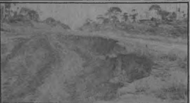
Obras Públicas está trabajando para subsanar este mal y la gráfica habla por sí sola.

El Ministerio de Obras Públicas, debe de estar estudiando la posibilidad de hacer en desvío o reforzar cierto tramo de la Carretera, ya que nuestro enviado especial, nos informó que la carretera en unos