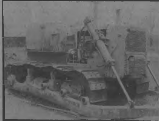
Otra gráfica mas que habla de la desidia y de la desesperación justificada de la comunidad por la falta de equipo necesario en la comunidad.

Este equipo está dañado desde hace muchos años y a pesar de las inquietudes presentadas por los Honorables Representantes y comunidad en general las gestiones para lograr que ese