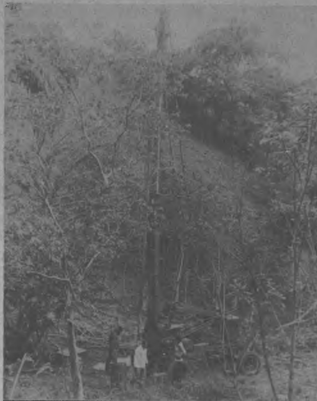
Esta gráfica nos ofrece la oportunidad de observar en plena labor de perforación a la máquina que fuera cedida por el Instituto Nacional de Alcantarillados (IDAA), dirigida por funcionarios de esa Institución del Gobierno Revolucionario.

dirige el Dr. Aristides Royo, Presidente de la República.