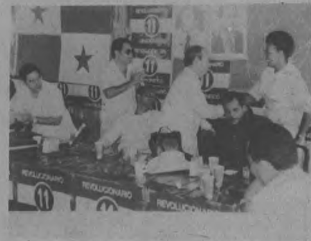
Aplauda por la satisfacción del deber cumplido, siempre una sonrisa lo acompañaba, nunca le faltaba, demostrando su gran sensibilidad social.