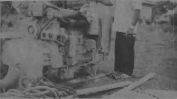
Esta es la Planta eléctrica que compró la Junta Comunal a un costo de cinco mil balboas (B/5,000) y que ya está dotando de luz a todas las casas de Taimati, como una respuesta del pueblo hacia su representante y una respuesta del Gobierno Revolucionario, "Junta, Pueblo, Gobierno Unidos Vencerán".

Mil (B/5,000) los postes y todas las lámparas todo fue hecho por la Junta Comunal y otras obras de beneficio Social que la Junta Comunal ha tenido que hacerle frente. Cabe destacar que todas estas actividades se pudieron hacer gracias al binomio Junta y Gobierno, como también se le brindó ayuda al Deporte en implementos y según nos manifestara el H.R.L. Melo, él espera que antes que termine su período en 1984, por lo menos el 95% de las necesidades de su Corregimiento serán correspondidas en favor de la Comunidad que lo eligió en 1978.