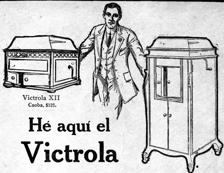
Victrola XII Caoba, $125.

LAS ORDENES DEL INTERIOR DE LA REPUBLICA se atienden con puntualidad y esmero.