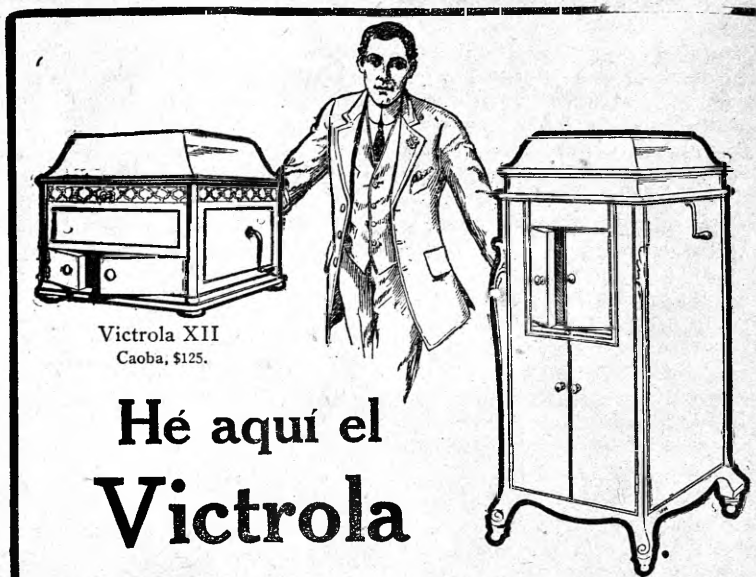
Victrola XII Caoba, $125.

Avenida Norte, esquina a la calle 5a.; frente al Hotel Marina y al costado de la casa presidencial.