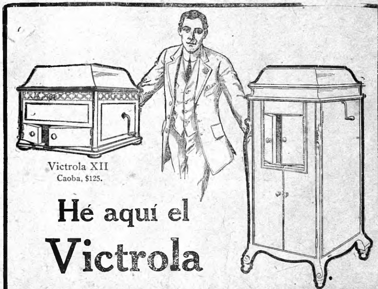
Victrola XII Caoba, $125.

Avenida Norte, esquina a la calle 5a.; frente al Hotel Marina y al costado de la casa presidencial.