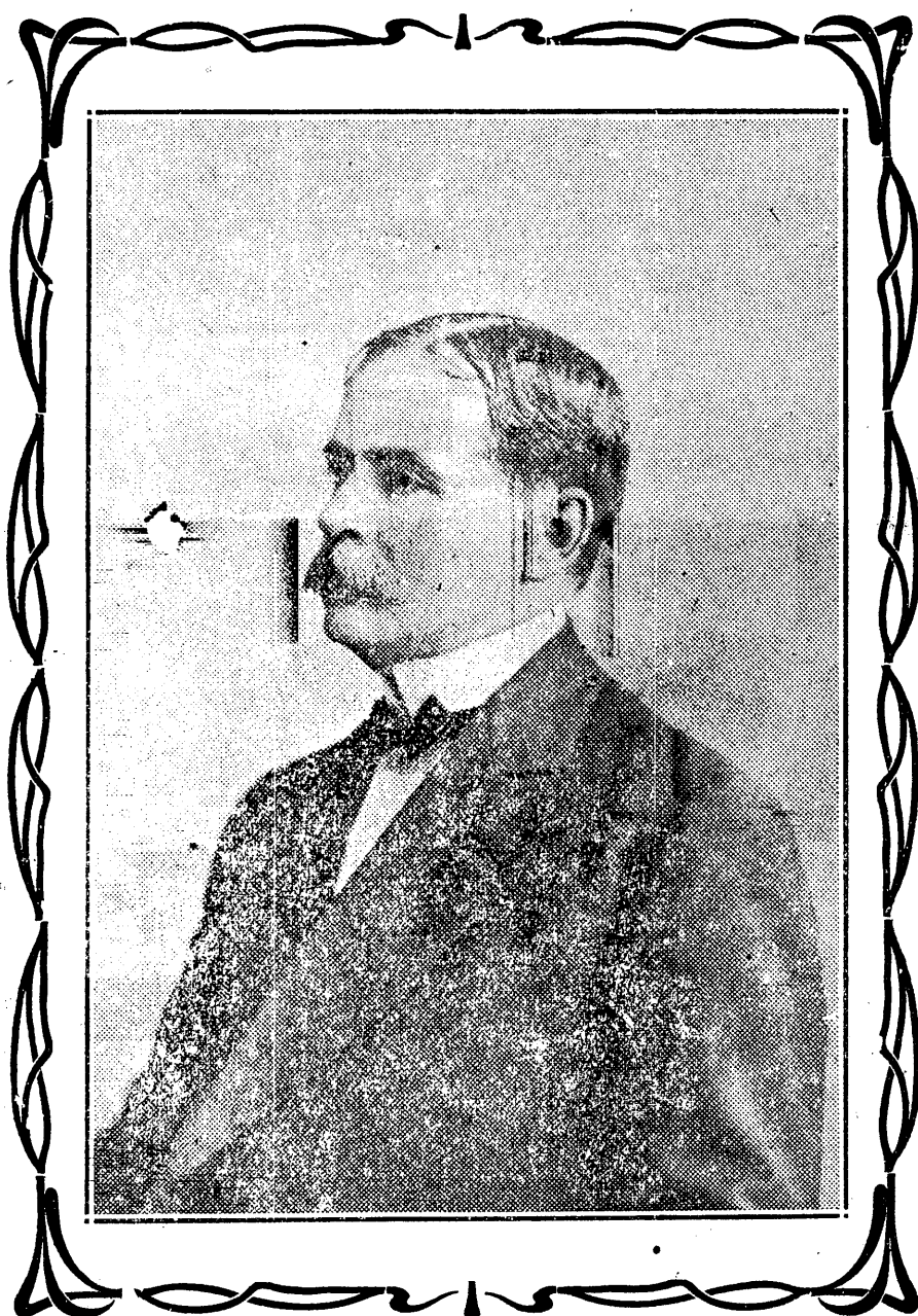
D. Rodolfo Chiari

Con particular agrado publicamos hoy el retrato del liberal intachable cuyo nombre precede.