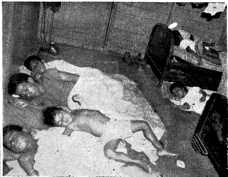
Mírenlos, son los niños panameños de un hogar (así se llama por costumbre) de la zona bananera. El padre es un obrero de la bananera. Los hijos duermen en el suelo. Hasta cuándo los niños pobres dormirán en el suelo? Pobres los niños de los padres obreros de las bananeras!