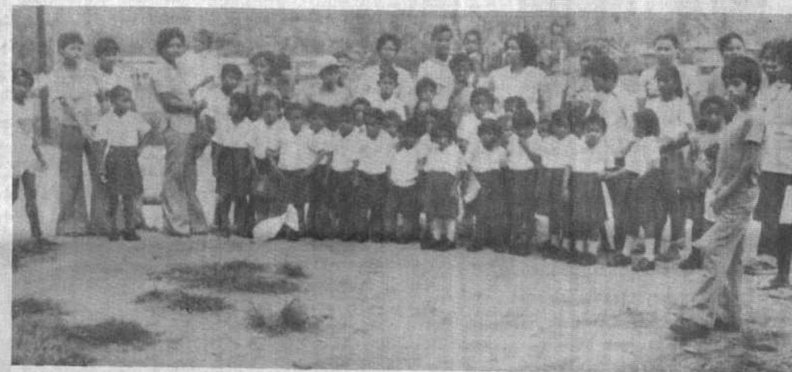
Fotos superiores; Dos aspectos de donaciones de uniformes, realizados por la Junta Comunal: 10A niños de escasos recursos económicos, 20 A los niños del Centro de Orientación Infantil y Familiar de Gatuncillo