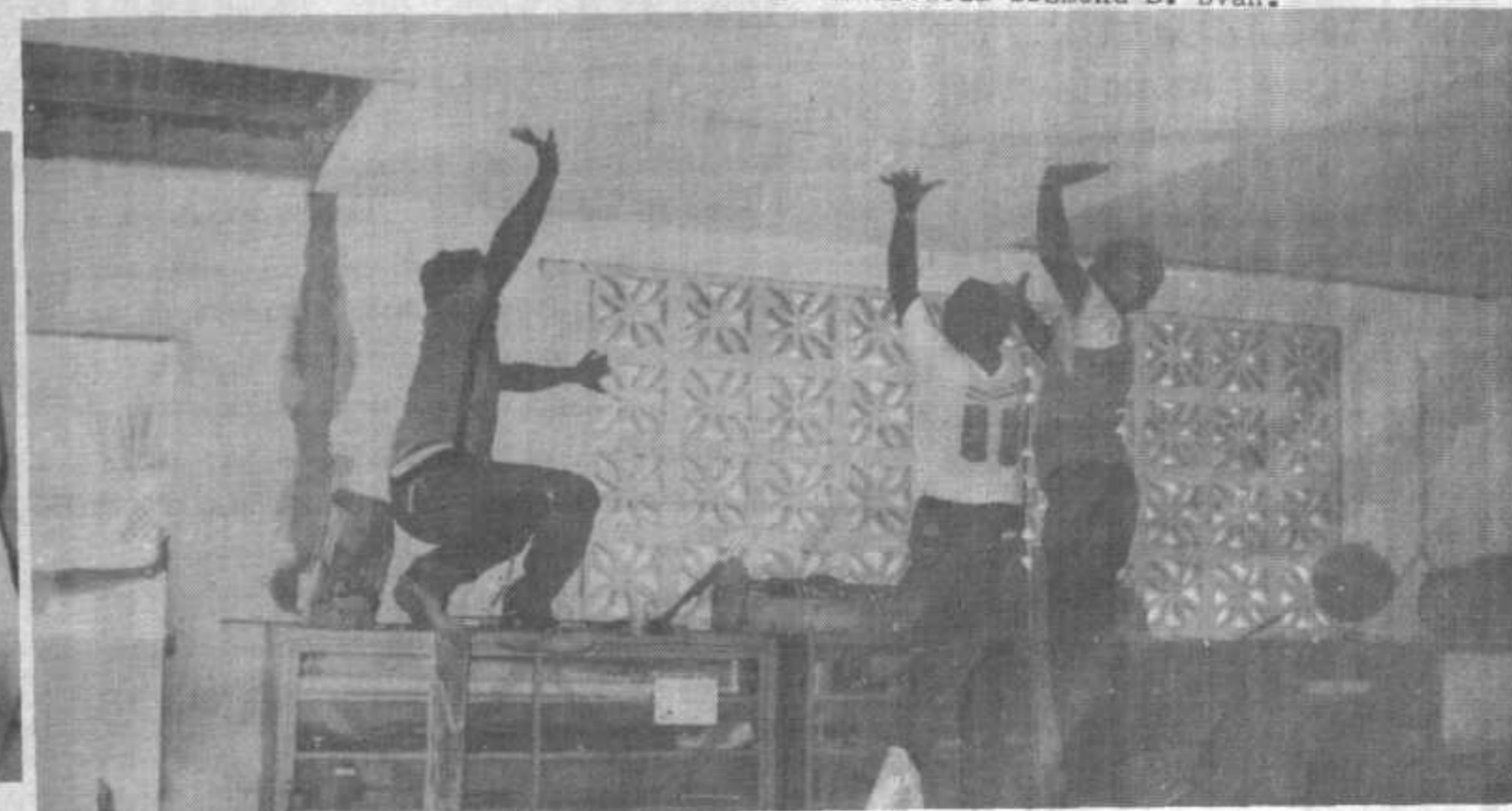
Fotos inferiores; Reparación del cielo-razo de la escuela Desmond E. Byan.