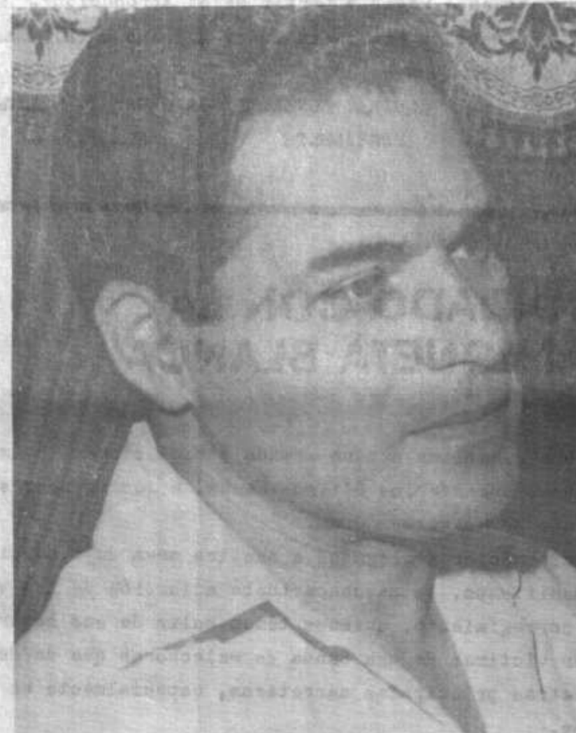
DR. ARISTIDES ROJO, Presidente de la República. Bajo su administración se ha fortalecido el Poder Popular, con el apoyo directo a sus Representantes.