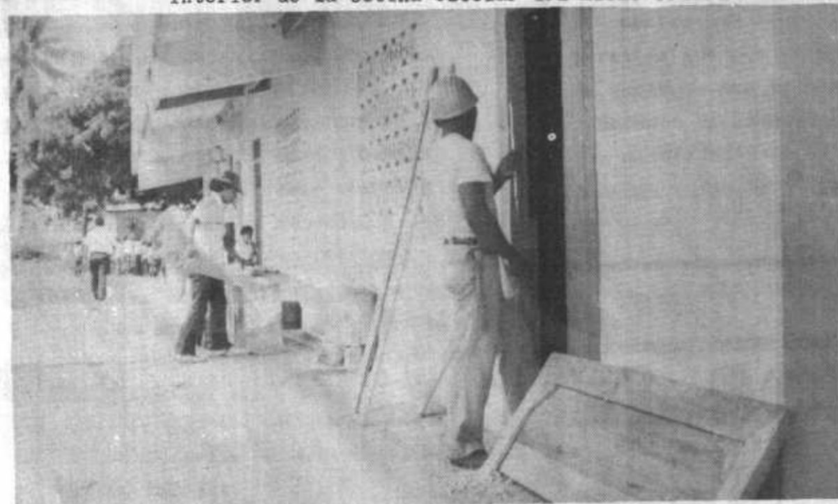
Fotos Inferiores; Aspectos de la reparación frontal de la escuela Desmond E. Byan y vista interior de la cocina escolar del mismo centro educativo.