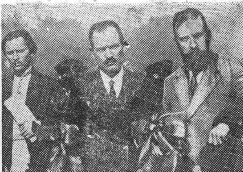
En la fotografía aparecen, de derecha a izquierda, Lenin, Trotzki (en el centro) y el hijo de Lenin, quienes presiden una peregrinación en honor de los camaradas muertos. (Petrogrado, noviembre de 1917).

sus fantásticas cosechas de trigo, centeno, avena, maíz, cebada, triguillo, —que la convierten en el granero de Europa— en la industrialización de los cultivos comparados de lino, algodón, cáñamo, girasol, remolacha de azúcar, patata, tabaco, té, etc., en el prodigioso incremento de la ganadería y la industria pesquera, que arrojan totales fabulosos según las estadísticas, en la exportación de caviar, de huevos, de cueros y en la producción de lanas, crines, pieles, en la cría del gusano de seda y en la multiplicación de sus industrias textiles. Si nos dedicamos a transcribir los datos estadísticos que tene-