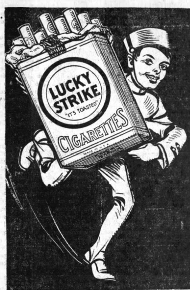
British-American Tobacco Co., (Panama), Ltd.

El 10. de los corrientes celebró "La Vanguardia Liberal", brioso diario que se edita en Bucaramanga, el cuarto aniversario de su fundación. Por tal acontecimiento lanzó una edición especial de gala, que el público recibió con entusiasmo. Bien por "La Vanguardia Liberal".