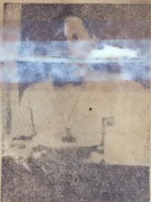
DON DOMINGO DIAZ A.

A quien con justa razón se le ha llamado luchador ejemplar del liberalismo, estará pronto entre nosotros con el entusiasmo y el valor civil de siempre a defender al liberalismo nacional, por cuyas doctrinas fueron hasta el sacrificio sus antepasados en un movimiento de plausible reivindicación libertaria. Su lucha solo terminará con el triunfo definitivo de la democracia.