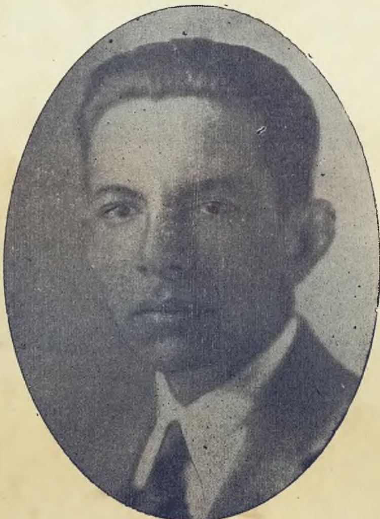
DR. HARMODIO ARIAS

—Desde que dispuse conceder todos los viernes entrevistas de prensa, me formé la determinación de circunscribirlas a las materias puramente administrativas o de interés general, pero con exclusión completa de la política; en cuanto a ésta, me reservé el derecho a dar, de tanto en tanto, cuando lo estimase oportuno y conveniente, comunicados a los periódicos. Y no es que de parte de periodistas aler-