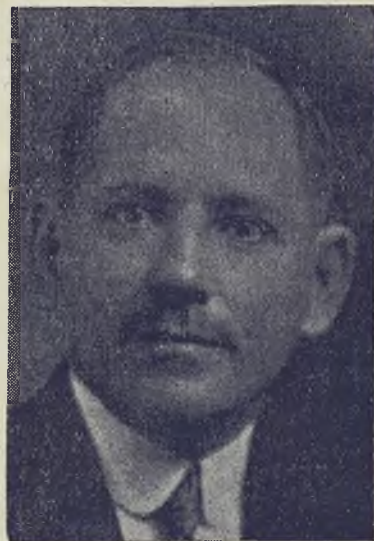
El hombre que “no cede”

no sabemos que se haya llevado a cabo la última entrevista.