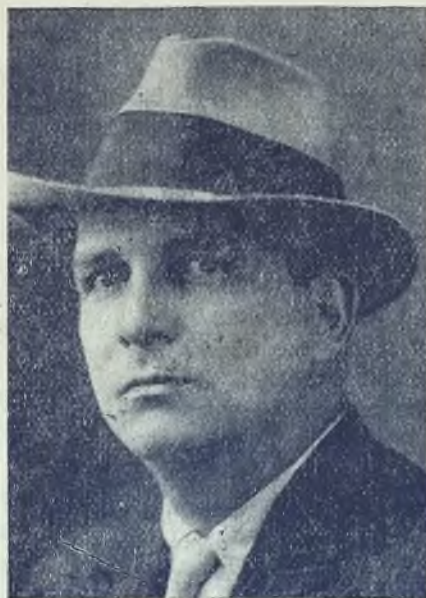
Hará declaraciones exclusivamente para TRIBUNA LIBRE en nuestra edición del 28