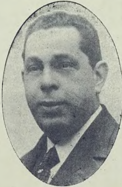
Habla exclusivamente para TRIBUNA LIBRE sobre el momento político.