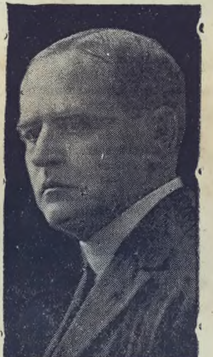
Ex-Presidente de la República quien hará trascendentales declaraciones para TRIBUNA LIBRE, el jueves.