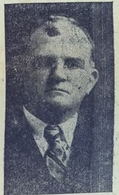
Sin reticencias ni titubeos, expresa su modo de sentir frente a los problemas políticos actuales.