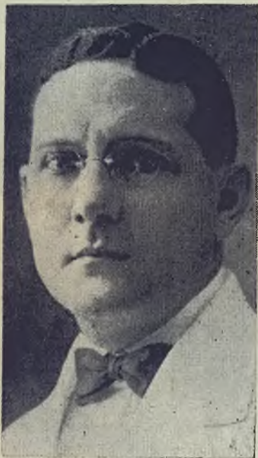
Está en un todo de acuerdo con la concentración liberal a base de ideales.