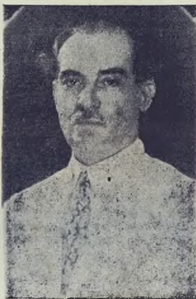
Nos Concede Entrevista de Gran Importancia

cieras tuvo el Gobierno o los agentes de éste para preferir a otras la escogencia que hicieran?