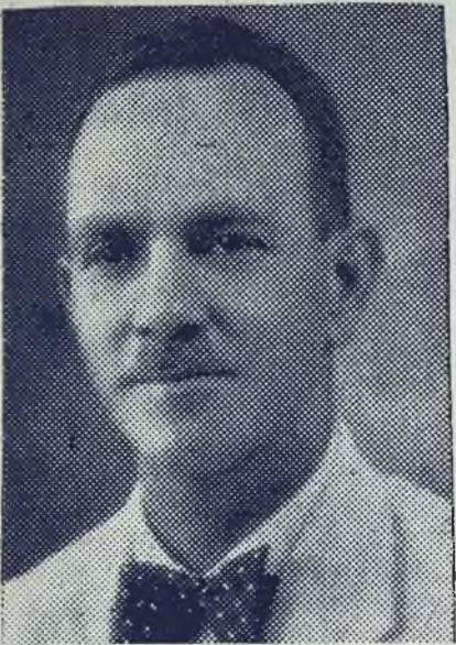
Contesta Nuestro Cuestionario.

ofrecido el señor Contralor, a la última pregunta, sobre la cuánto quedan reducidos en la actualidad los “seis millones”, después de la cantidad de remates que ha habido necesidad de efectuar y después de deducidos los gastos ocasionados con motivo de su manejo, todo esto frente a la depresión del dólar y demás circunstancias que pudieran influir en la disminución de aquella suma? El señor Contralor, con sinceridad que le honra, contesta así el interrogatorio anterior: