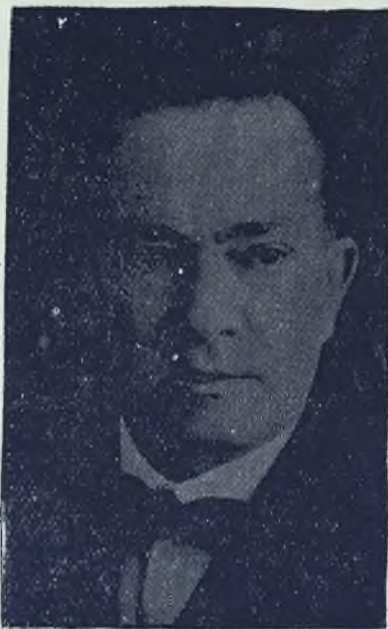
Cuya candidatura desaparece del escenario político.

en ella, se pensó también en que ella sería respaldada por el clarismo y por tanto tendría fuertes posibilidades de responder a la confianza que en ella se depositaría, parece haber llegado al convencimiento de los que la apoyaban que el Secretario de Relaciones Exteriores no es una