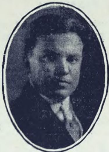
Quien con el propósito de habilitarse para ser candidato a la Presidencia de la República, renunció ayer el alto cargo de Secretario de Hacienda y Tesoro.

te al efecto, se inauguraron las sesiones de esa magna asamblea política. Más de setenta delegados de todas las provincias y distritos ocuparon sus puestos a la hora indicada, dejándolo de hacer apenas una media docena de representantes, no porque no hubiesen sido electos en los distritos respectivos, sino porque motivos insalvables les impidieron contestar a lista.