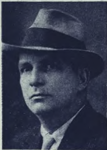
Jefe del Partido Liberal Renovador, cuya 2a. Convención Nacional se reunió en Aguadulce.

El Directorio Nacional del Partido Doctrinario ha sido pues compelido a acogerse al pacto Díaz-Jiménez y decidir, como decidirá, esta semana, con el concurso de su jefe el Dr. Arias Madrid, cuál de los dos compactados llevará a los comicios la bandera del partido. Parece que la opción la lleva el Secretario de Hacienda, señor Jiménez, a quien, de otra parte, se le atribuye connivencia o participación en la renuncia del Dr. Alfaro.