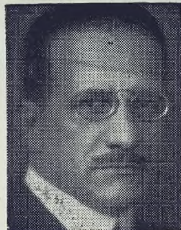
Quien ha renunciado a ser escogido como candidato presidencial por el Doctrinario.

más cumplido acierto en sus deliberaciones; entregar el informe de fin de ejercicio de la dirección del partido, y rescindir, a nombre de ésta, el mandato que le