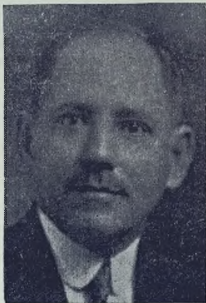
DON DOMINGO DIAZ A.

La tensión política que ha venido acentuándose últimamente y que llevaba trazas de culminar con la ruptura del "pacto" célebre entre don Domingo Díaz A. y don Enrique A. Jiménez, miembros prominentes del Partido Liberal Doctrinario, culminó con la escogencia del primero por miembros del Partido Liberal Doctrinario y del Gran Jurado Nacional de Elecciones erigidos en jueces y representantes del sentir popular.