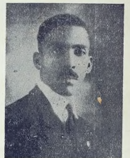
Jefe de la Oficina del Trabajo, a quien va también dirigida nuestra excitativa para reglamentación del tráfico