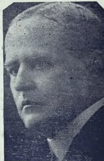
DON RODOLFO CHIARI