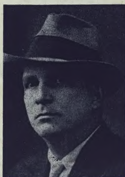
Jefe del Partido Liberal Renovador

a honores que ya gocé, ni glorias que otrora me sedujeran; aquí estoy, digo, dispuesto a hacer cesar la discordia y el desmembramiento del Partido Liberal.