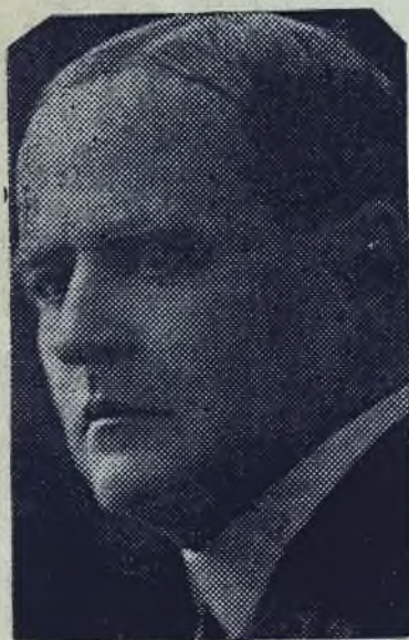
Jefe del Partido Liberal Nacional

En las últimas horas de la tarde de antes de ayer, el Dr. Belisario Porras dirigió a los diferentes jefes de facciones liberales la circular que más abajo reproducimos, invitándolos a secundarlo en su generoso proyecto de la Unificación Liberal. Ya los señores don Rodolfo Chiari, jefe del Partido Liberal Nacional, y don Francisco Arias Paredes, jefe del partido Liberal Renovador, habían aceptado ingresar en el movimiento unificador, tal como lo propuso el ilustre caudillo, doctor Porras, desde Europa, a base de generosidad, altruismo, desprendimiento y abnegación. A este respecto dijo, textualmente, don Belisario el día de su arribo a esta capital: