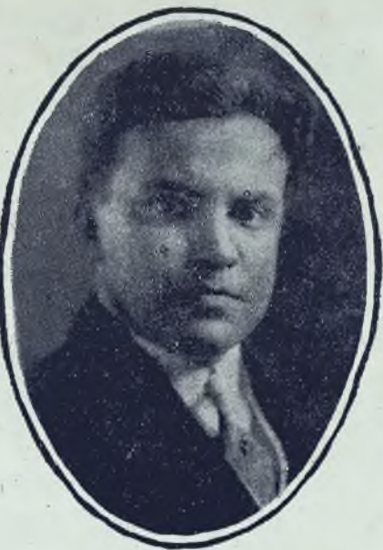
Jefe del Ala Izquierda del Partido Doctrinario

nido observando con tristeza cómo el Partido Liberal, de tan gloriosas tradiciones en nuestra patria, era presa de un proceso de desintegración que ha ido acentuándose día por día hasta tenerlo hoy tan dividido, que pone en peligro su hegemonía y hasta su existencia misma. Aún cuando para ello tuviera que sacrificar la comodidad, la tranquilidad y el descanso a que me da derecho mi larga carrera pública, no he vacilado en hacerlo porque yo no puedo permanecer impasible ante las vicisitudes del Partido al que he dedicado toda mi vida y por el cual he luchado en la paz y en la guerra, en el valle y en las alturas, endiosado o calumniado.