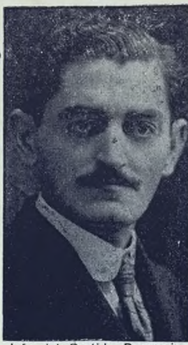
Jefe del Partido Progresivo (en formación)

de la Zona del Canal de Panamá, lo cual es una nueva y flagrante violación de la neutralidad de dicha vía interoceánica.