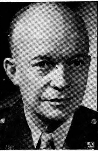
DWIGHT D. EISENHOWER

Las tropas americanas, inglesas y francesas en un magnífico ejemplo de coordinación y eficiencia militar acaban de barrer de los territorios del Norte de Africa a los Ejércitos del Eje. Los "Afrika Korps" de Rommel y Von Armin sobre cuya legendaria destreza han llenado columnas durante seis meses todos los comentaristas militares de la "United Press", han sido barridos por el hierro y el fuego de las Naciones Unidas y por el arrojo de las fuerzas aliadas. Un capítulo más de la presente