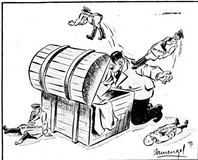
BUSCANDO UNO BUENO.

Todavía nosotros esperamos. No hemos perdido por completo la esperanza. Creemos, ahora que han desaparecido las razones o motivos en favor de una estrategia discutible y que pudo aconsejar el uso del epíteto de QUERIDISIMO, para dirigirse al verdugo de España, y el envío de grandes cantidades de materias primas usadas para la guerra, que la figura cumbre de las Democracias, Excmo. señor don Franklin Delano Roosevelt salvará a la España libre y democrática. Creemos que no autorizará otra ley de embargo de armas para los paladines que muy pronto habrán de luchar para el restablecimiento de la Democracia en España.