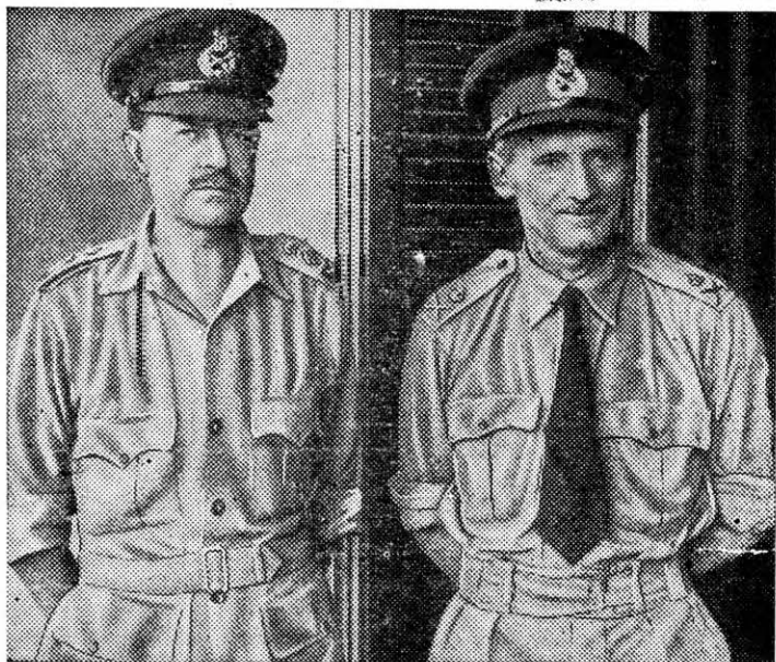
Teniente General Montgomery y el General Alexander, cuya victoria crea las premisas para el II frente europeo.