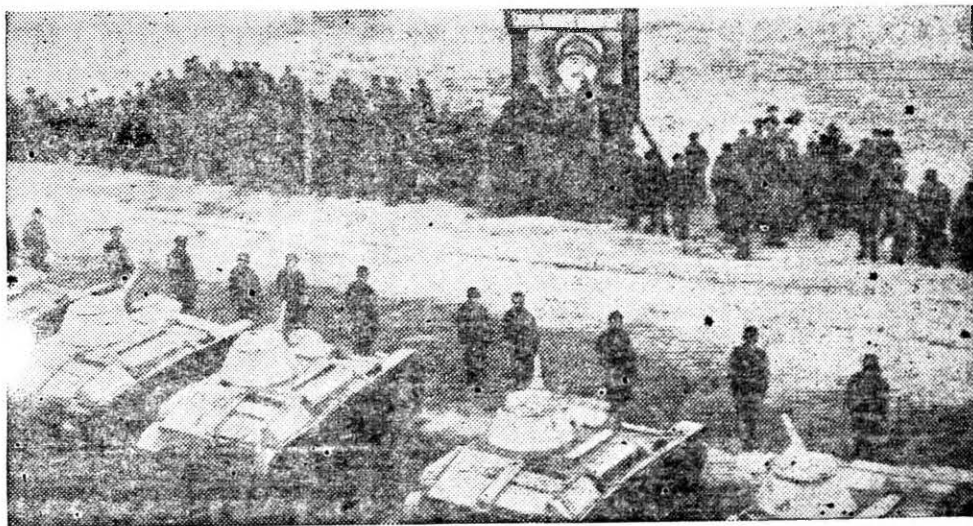
Antes el 10. de Mayo en la URSS era celebrado con grandes fiestas. Hoy, el pueblo y el Ejército Rojo lo celebran incrementando la lucha contra el enemigo de la Humanidad.

— Comité Nacional de Mujeres Antifascistas de España — Confederación Nacional del Trabajo, CNT — Fogar Galego — F.O.A.R.E. (Sección Española) Hogar de la Juventud Española — Liga Nacional de Mutilados e Inválidos de la Guerra Española — Partido Acción Nacionalista Vasco — Partido Comunista de España — Partido Comunista de Euzkadi — Partido Esquerra Nacional a Catalunya, Izquierda Republicana — Partido Galeguista — Partido Socialista Obrero Español — Partido Socialista Unificado de Cataluña — Partido Unidad Republicana — Republicanos Vascos — Unión Federal de Estudiantes Hispanos — Unión General de Trabajadores de España, U.G.T. — U.G.T. de España, Grupo Gallego — U.G.T. de España, Secretariado de Cataluña.