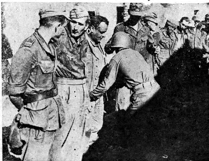
Un soldado norteamericano registra a un grupo de prisioneros nazis capturados durante la ofensiva aliada contra las líneas alemanas al norte de Nápoles.