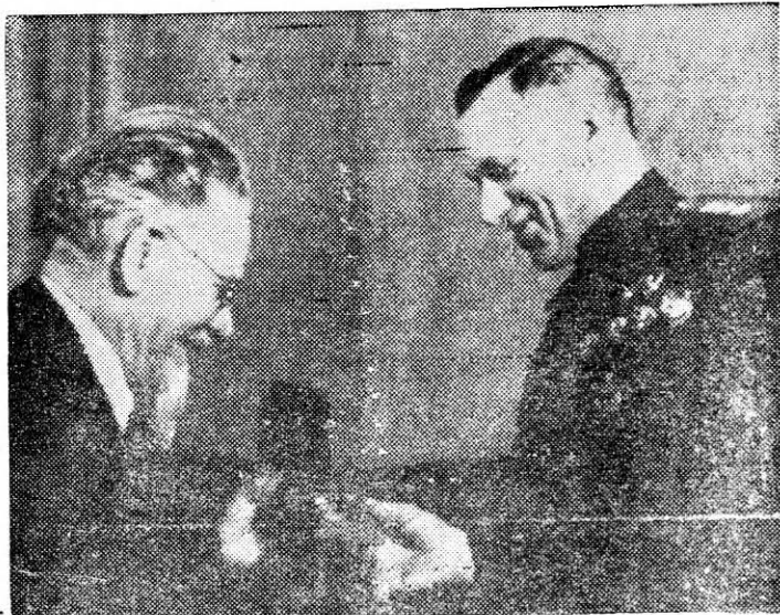
Kalinin, Presidente del Soviet Supremo, condecora al General K. Rokossowsky, libertador de Stalingrado