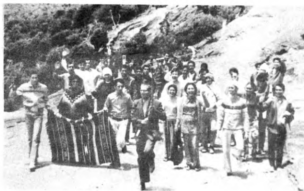
Aquí estamos a 3.436 metros de altura, mientras regresamos del Volcán Irazú.

Cumpliendo invitación de la Municipalidad del Cantón Central de Cartago, nuestra Banda de Música viajó en días pasados a la República de Costa Rica, para deleitar a los hermanos costarricenses, con motivo de celebrar el 150 aniversario de su Independencia de España (1821 - 1971).