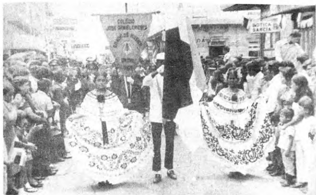
En pleno desfile durante el 15 de setiembre por la calle principal de Cartago.