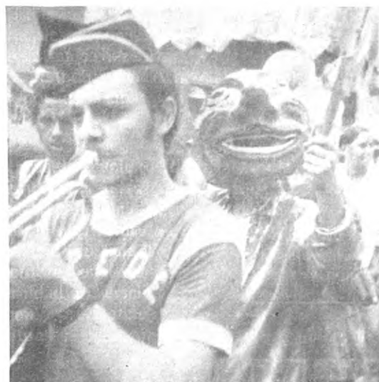
Ecos de la verbena escolar de agosto de 1971.

ENCUENTRE DIEZ DIFERENCIAS ENTRE LOS DIBUJOS DE LOS CUADROS "A" Y "B"