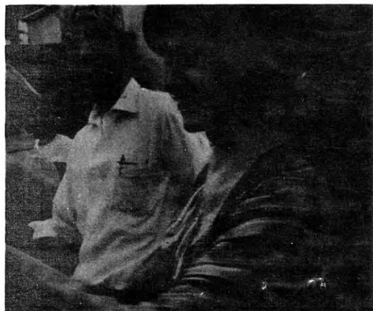
La Pre Verbena fue alegre, bulliciosa, un jolgorio de la juventud, renacer del espíritu, una catarata de recuerdos.