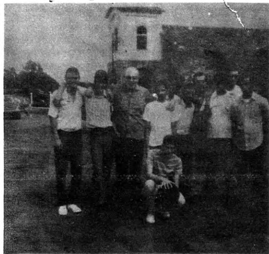
Fecundo y positivo encuentro en la colonial San Francisco de la Montaña. Se cantó, se disertó, hubo fiesta del espíritu y un poco de buen humor, propio del Cristianismo de los nuevos tiempos.

Hecho por: Gustavo Ortega y Ríos VI "C" Letras