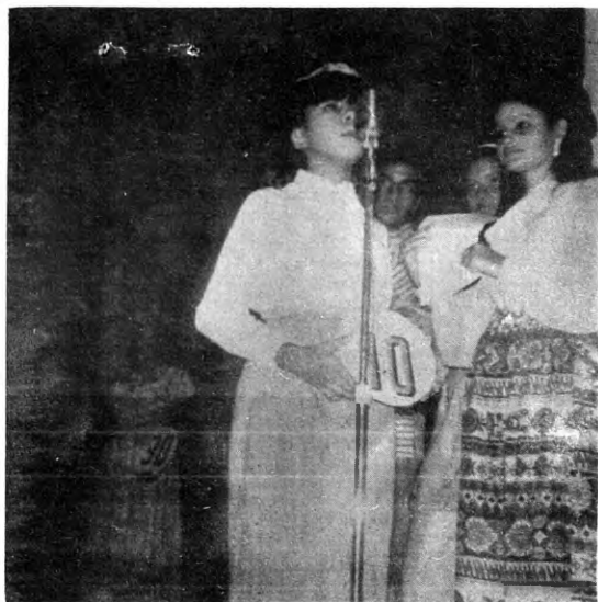
Ecos del pasado. Baile de novatos en abril de 1971. Todo el mundo se divirtió y todos salieron satisfechos.