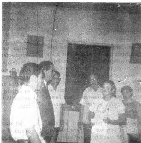
Nuestro señor Director recibe generosa ayuda del Municipio para la compra de instrumentos de la Banda de Música del Plantel.

Secretario de Relaciones Públicas de la Banda de Música del Colegio José Daniel Crespo