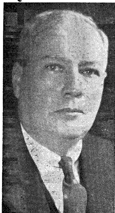
DR. AUGUSTO SAMUEL BOYD,

quien en su carácter de Primer Designado reemplazó al ilustre Dr. J. D. Arosemena, Presidente Constitucional de la República. La ciudadanía tiene fe en la actuación gubernamental de este meritorioso compatriota, porque su inteligencia y su hombría de bien lo han hecho siempre acreedor a la admiración nacional.