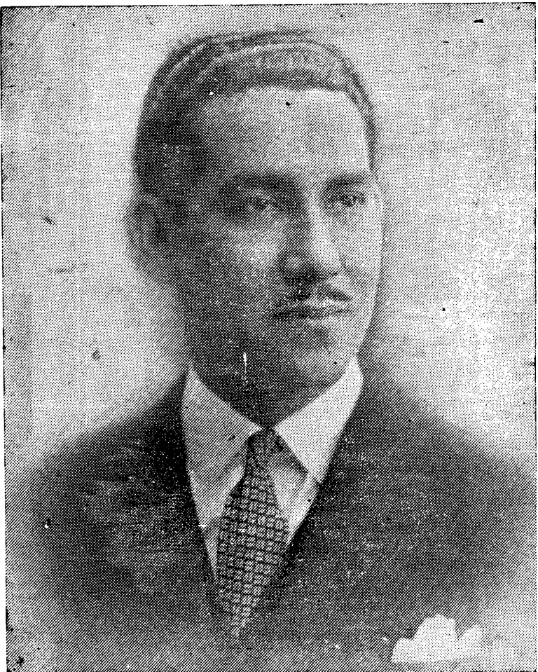
DR. ARNULFO ARIAS,

destacado líder de la juventud nacional a quien se tributó a su regreso a la patria una sencilla, pero imponente y concurrida manifestación de simpatía el 21 de los corrientes. Representantes de todos los pueblos de la República concurrieron a darle la bienvenida. Su triunfo como candidato está asegurado con el respaldo absoluto de la masa popular y con las garantías de un gobierno democrático, ajeno a influencias extrañas.