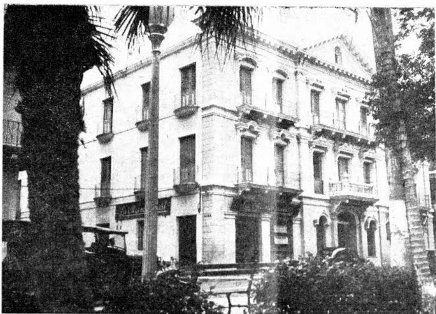
Edificio donde funcionará el próximo año este plantel de educación, después de ser pedagógico e higiénicamente acondicionado.