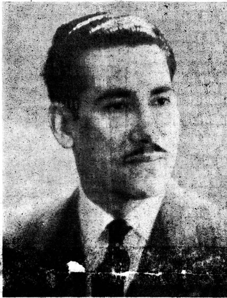
DR. ARNULFO ARIAS, Candidato Nacional.