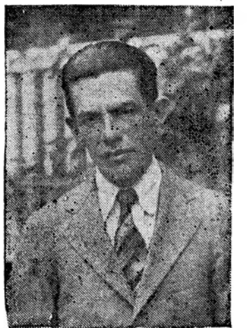
DR. HARMODIO ARIAS

Abarca esta Inspección los Distritos Municipales de