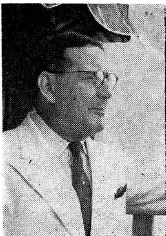
Rector de la Universidad Nacional, quien pronunció el discurso que en esta hoja publicamos. La voz autorizada y convincente del destacado educador tiene eco en la juventud de la República que ve en él un verdadero orientador.

sus ramos, recibirán la luz y la influencia constantes del de artes liberales, el cual, además de poder otorgar, el grado de bachiller en artes o en ciencias a los que deseen dedicarse a estudios superiores generales, coadyuvará a que quienes se dediquen a las carreras técnicas y profesionales, reciban ese fondo colateral de cultura esa perspectiva, y ese sentido de proporciones que es lo que constituye verdaderamente