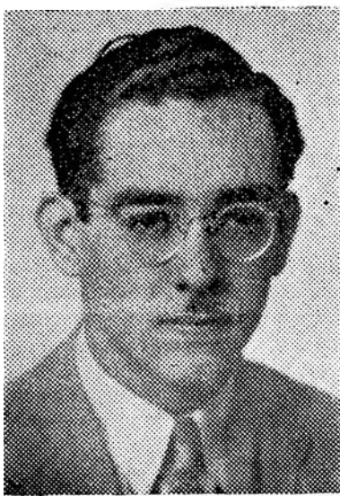
Hijo de la provincia chiricana, quien ocupó el primer puesto de honor al graduarse como Bachiller en Letras en el Instituto Nacional. Nuestra sinceras felicitaciones y nuestros votos por mayores éxitos.

sus esfuerzos, a su constancia, a su afición al estudio y a sus ansias de mejoramiento y de superación, ha logrado graduarse con notas brillantes y con las mejores recomendaciones. Esta circunstancia le ha merecido el honor del ofrecimiento de una posición en el profesorado de aquella República hermana a la cual regresará dentro de pocas semanas. Felicitamos al caballero e inteligente amigo y le auguramos muchos triunfos en el futuro.