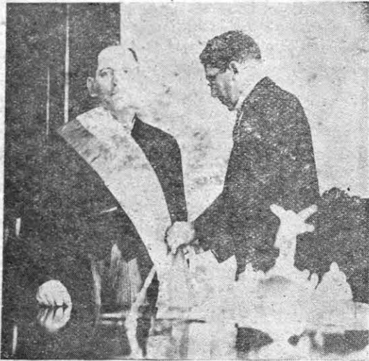
Fotografía tomada en el momento en que el Magistrado Miguel Angel Grimaldo colocaba la faja Presidencial a nuestro nuevo Presidente Don Domingo Diaz A.