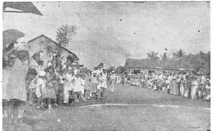
El entusiasmo que despierta en deporte en el interior no es cuestión de fantasía. En la presente foto puede admirarse la inmensa muchedumbre que presencia las competencias Atléticas efectuadas en David, Provincia de Chiriquí, hace poco tiempo.

CASTILLO Y RODRIGUEZ LISTOS PARA SU COMPROMISO