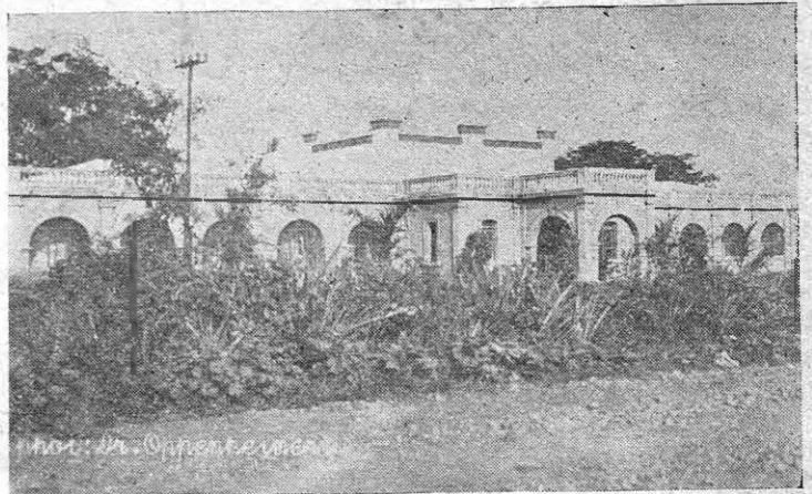
El Nuevo Hospital de Chitré que será inaugurado el Sabado de esta semana por el Dr. Arnulfo Arias. Este es uno de los Hospitales mejor acondicionados y el pueblo de Chitré se encuentra satisfecho y agradecido lo mismo que las demas poblaciones cercanas.