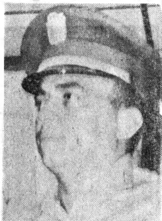
Cap. Rubén D. Paredes

Capitán Rubén Dario Paredes, Jefe de la Guardia Nacional de la Zona Norte, cuya labor en pró de la comunidad colonense se ha evidenciado en la merma de los atentados por elementos del hampa, que mantiene a raya este destacado oficial de la Guardia Nacional.