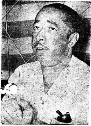
"BILO" ...detrás de nuevas pistas...