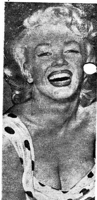
La tremenda Marilyn Monroe

Para delicia del lector publicamos la incendiaria figura de Marylin Monroe (hoy Sr. Miller) mostrando sin egoísmo parte de sus sdonas. Fenomenal, verdad?