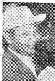
SIMONS ...el socio