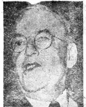
John Foster Dulles