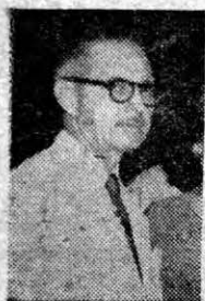
O BARRIO ...el azote...