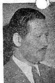
DE DIEGO ...garantías...