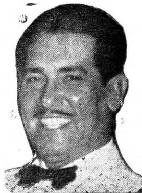
ARNULFO ARIAS (Panameñismo)