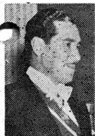
Dr. Arnulfo Arias M.