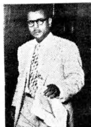
Procurador de la Rosa ...ineptitud...

No hace mucho, otro funcionario de menor jerarquía, formulaba también graves acusaciones contra altos oficiales de la