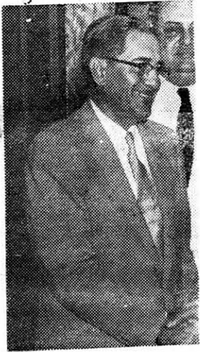
...Su caída es inevitable...