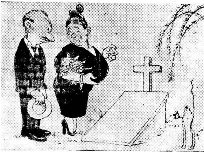
¿Y quién se le murió Comadre? — Ay Compadre la Difunta Coalición, que no aguantó el Dolor de Cabeza.

se encuentra fuera de su posición, haciendo operaciones en tierras extrañas.