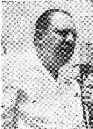
"TEMI" ...Apresura la caída del Mandatario soberbio...