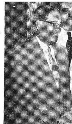
"ERNESTITO" ... Repudiado de un confín a otro de la República...