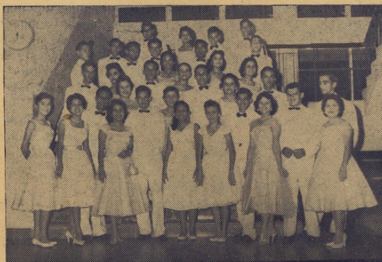
En la presente vista se puede apreciar parte de los 50 miembros del actual Conjunto de Bailes de Salón de la Escuela Profesional Isabel Herrera Obaldía que desde el año 1949 ha venido contribuyendo a mantener el prestigio cultural de nuestro plantel.

El libro gobierna a los hombres y es el maestro del porvenir. R. Poincaré.