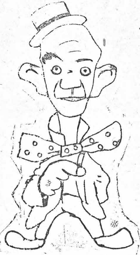
The Wise Guy—Pipe, the bump of Wisdom on the left side of the head.

If you want anything, or you lose anything, see The Witch and you will be sure to get the result that you need through her ADVERTISING MEDIUM.