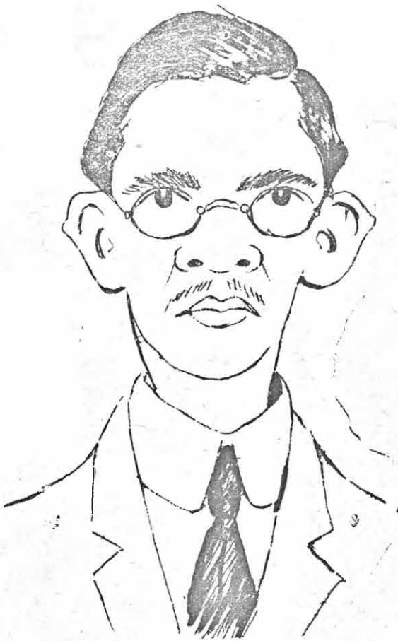
Tesorero sin Tesoro