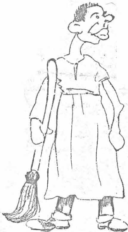
Getting ready for the Contingent.

"Sure! I kissed a girl and she caught me."—Boston Transcript.