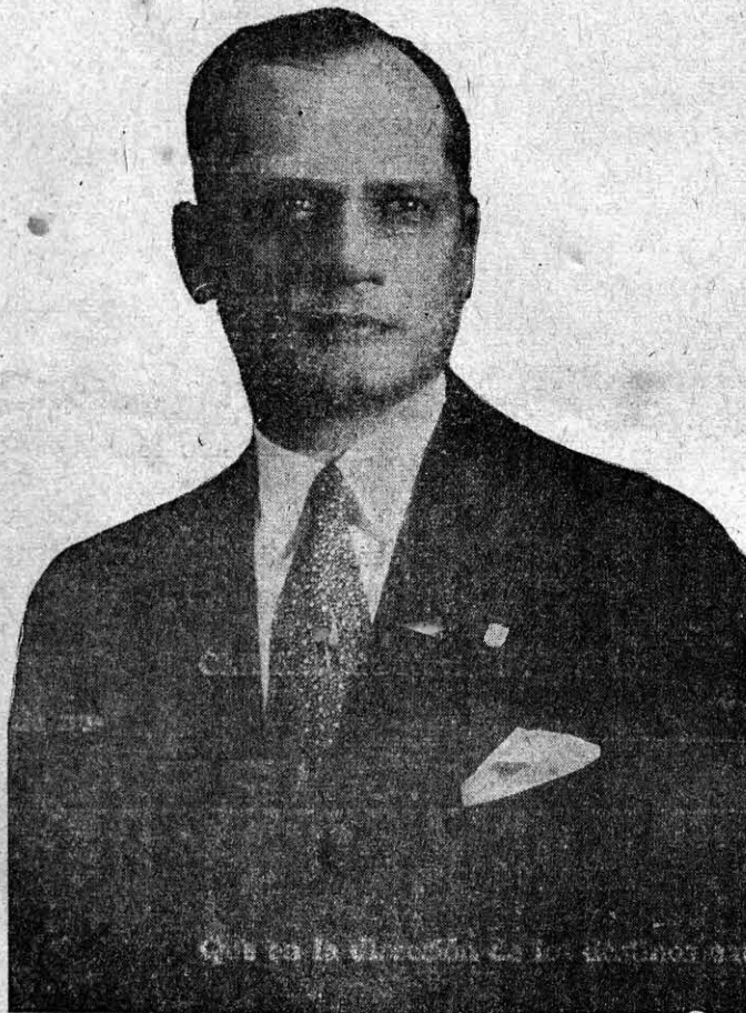
ALCALDE DEL DISTRITO CAPITAL,

Quien ha sido designado Patrón y Abanderado de las Fiestas Patrias del 28 de Noviembre. El popular "Peruano" ha preparado en compañía del Comandante en Jefe del Cuerpo de Bomberos, un suntuoso programa para dicho día, el cual ofrecemos a nuestros lectores en esta misma página.