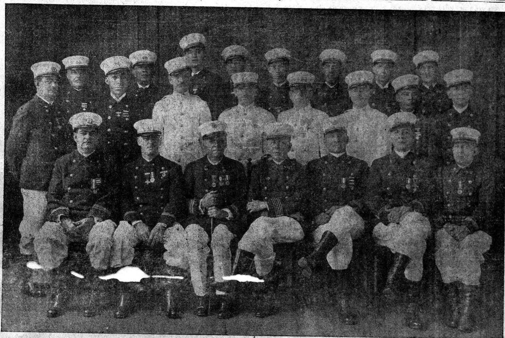
EL RELATOR se complace en presentar a sus lectores la Oficialidad del Benemérito Cuerpo de Bomberos de Panamá, como un homenaje a esa Institución en el día de su aniversario.