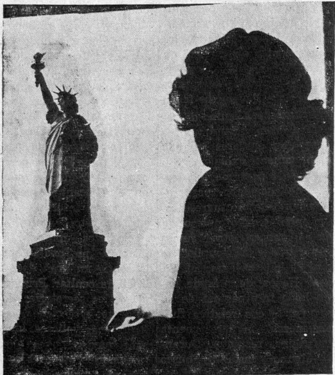
Estatua colosal de 46 metros de altura, donada por el gobierno de Francia a los Estados Unidos (1884) y colocada a la entrada del puerto de Nueva York.