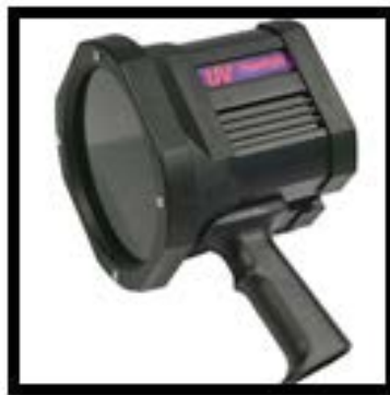
Imagen # 2: Lámpara de luz UV BigBeam