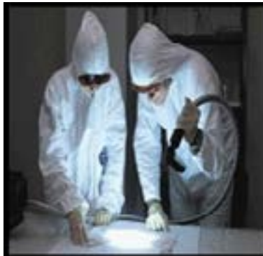
Imagen # 1: Fuente de luz Mini crime scope