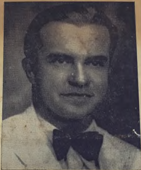
EXCMO. SEÑOR E. A. JIMÉNEZ, Presidente de la República.

Próxima a cristalizar la idea de la Unificación Liberal que tendrá como máxima expresión una Gran Convención del Liberalismo Istmeño y como consecuencia inmediata de los deseos del Excmo. Señor Presidente de la República, don Enrique A. Jiménez, quien como liberal y demócrata ha venido preocupándose porque esa Unificación sea una realidad, interpretando con su proceder las aspiraciones de la gran mayoría del pueblo panameño, nada más justo, nada más oportuno que el homenaje que en el día de hoy le