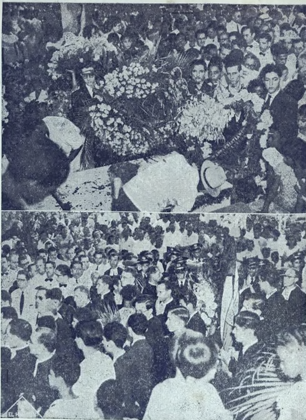
ARRIBA: Alumnos del Colegio de La Salle depositando ofrendas florales sobre la tumba del insigne patriota. ABAJO: Otro aspecto del sepelio, en el cementerio.