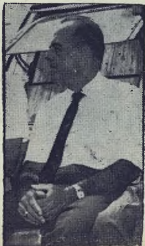
ROBERTO F. CHIARI Presidente.