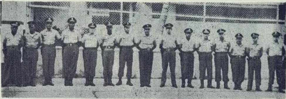
Presentamos a nuestros lectores toda la oficialidad de la Guardia Nacional, Sector Atlántico, la cual está bajo la dirección de uno de los militares panameños que más se ha destacado dentro de nuestro Instituto Armado, Mayor Omar Torrijos.

SALUDA AL PUEBLO COLONENSE DESEANDOLE MEJORES DIAS