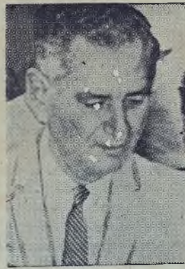
Excmo. Sr. Marco A. Robles Presidente de la República.