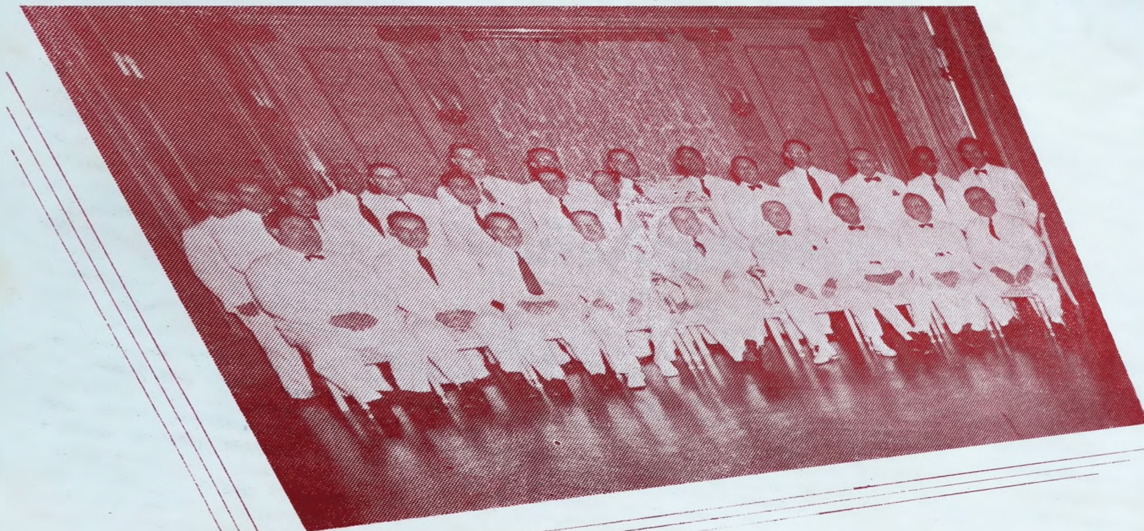
Fotografía de los Honorables Miembros del Ayuntamiento de la Provincia de Panamá, que clausuró sus sesiones el 31 de Diciembre pasado, habiendo obtenido brillante éxito en sus labores.